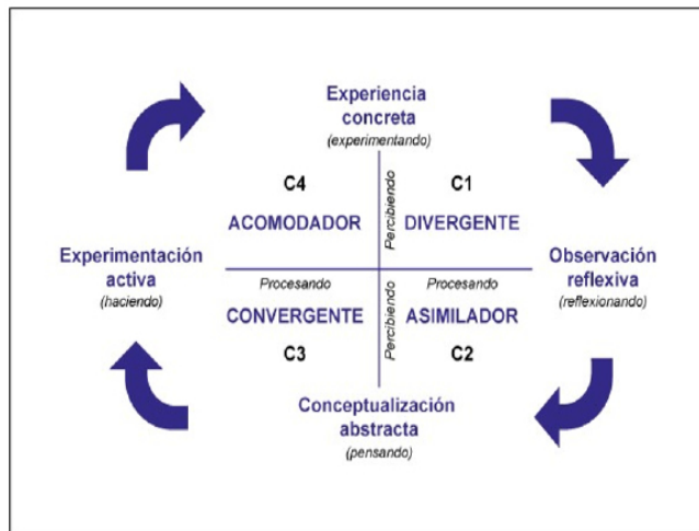
Figura 1. Modelo de aprendizaje Learning Style Inventory (LSI). Fuente: Kolb (1984, p. 15).

En este sentido, Vergara (2015) señala que el modelo de aprendizaje desarrollado por Kolb en 1984 denominado Learning Style Inventory (LSI) [Inventario de estilo de aprendizaje por su traducción al español], toma como eje central la experiencia directa del estudiante, argumentando que para aprender es necesario disponer de cuatro capacidades básicas: Experiencia Concreta (EC), Observación Reflexiva (OR), Conceptualización Abstracta (CA) y Experimentación Activa (EA).