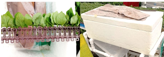
Figura 2. Izquierda: esquejes de Lantana colocados en el implemento “peineta” / Derecha: termo para conservación de los esquejes.