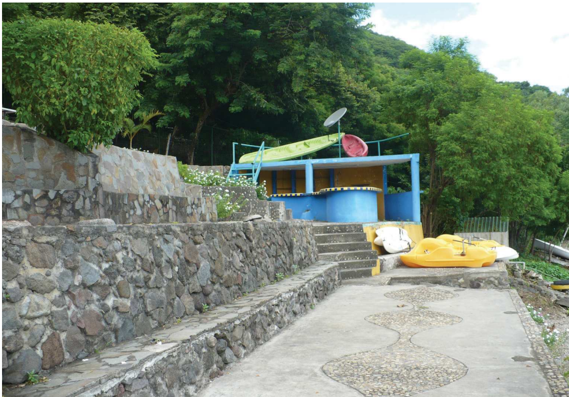
Facilidades recreativas Norome hotel y resort

Se constata la existencia de los servicios públicos como el de transporte, salud, educación, energía eléctrica y agua potable para el beneficio de la población residente.