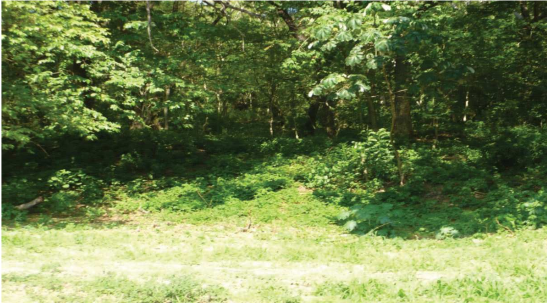
Aspecto del bosque por el mirador de Diriá.