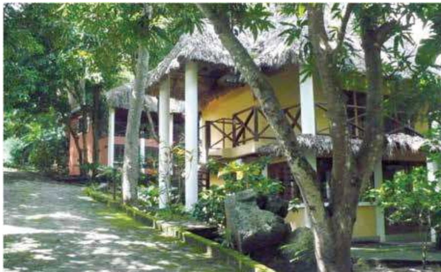
Foto 8. Hotel Norome Resort Villas

Este gran hotel ofrece actividades variadas como: voleibol acuático, entretenimiento nocturno con baile y karaoke, tours clásicos, masajes relajantes, caminatas ecológicas por el sendero los congos, piscina y área de juegos para niños, dos piscinas de adultos, kayaks, veleros y bicicletas acuáticas y un gran centro de conferencias para 200 personas.