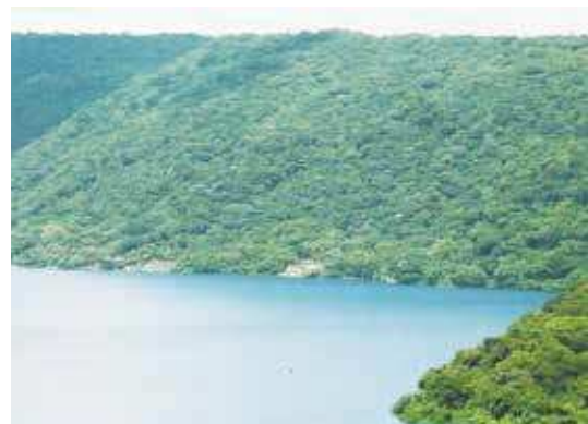
Foto 4. Laderas de Laguna Apoyo.

La belleza paisajística del sitio, la naturaleza de abundante flora y fauna, las tranquilas y limpias aguas de la laguna y el amplio anillo boscoso de las laderas hacen de Apoyo un destino increíble para visitantes nacionales y extranjeros, con una interesante oferta de actividades turísticas.