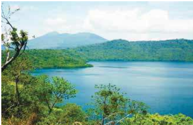
Foto 1. Reserva Natural Laguna de Apoyo.

Aunque no se cuentan con cifras precisas, según la Alcaldía municipal de Catarina se