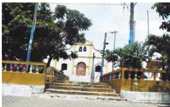
Foto 5. Iglesia de Catarina.

La iglesia con rasgos coloniales fue construida en el año 1800 y fue consagrada a "La Virgen Mártir de Santa Catalina. Es un templo asentada sobre una pequeña loma que domina toda la ciudad, es famosa por las actividades religiosas en honor a su santa patrona (Entrevista a funcionarios de la alcaldía).