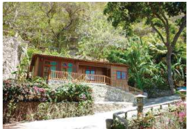
Foto 7. Cabañas a orillas de la Laguna de Apoyo.