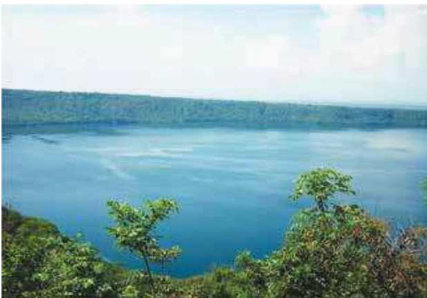
Foto 3. Paisaje de Laguna Apoyo.

La Laguna de Apoyo tiene una extensión territorial de 3,500 hectáreas que pertenecen al Sistema Nacional de Áreas Protegidas de Nicaragua. Está rodeada por dos ciudades principales Masaya y Granada y tres municipios: Diriá, San Juan de Oriente y Catarina.