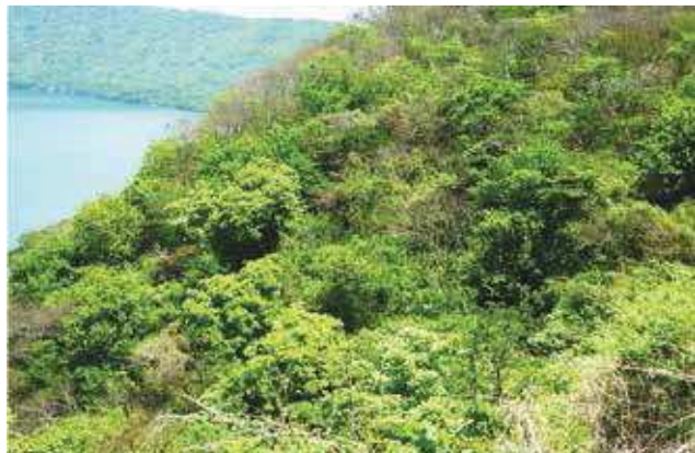
Foto 2. Bosque de la Reserva.