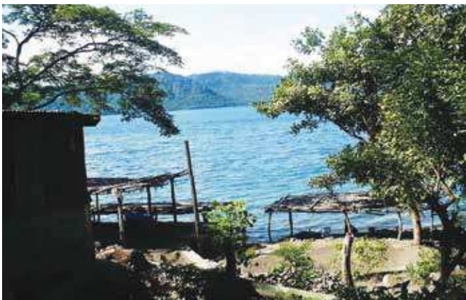
Foto 6. Mirador de la Laguna.

El restaurante “del lago” con capacidad para 350 personas ofrece un variado menú con platos de excelente sabor y banquetes de primera calidad.