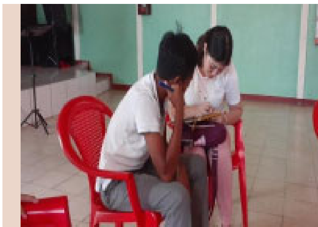
Autoras en proceso de entrevista

Por otro lado, en el contexto educativo, las subcategorías estudiadas fueron el papel de la escuela, la concepción de los docentes sobre las prácticas de crianza y actitudes de los estudiantes, ya que es necesario conocer como la escuela incluye los modelos de crianza y refuerza a los adolescentes en dicho tema.