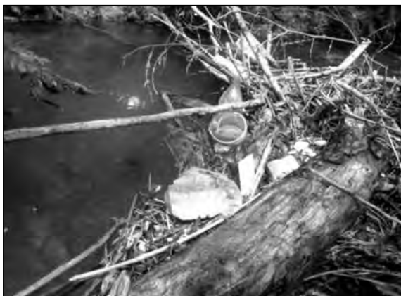
Figura No. 1. Presencia de desechos diversos en el río Trintara.