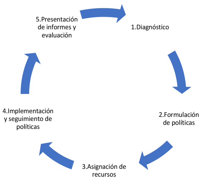
Figura 1: Ciclo de planificación de políticas o proyectos educativos

El ciclo de planificación de políticas o proyectos educativos incluye varias etapas, entre ellas se destacan las siguientes: diagnóstico, formulación de políticas, asignación de recursos, implementación y seguimiento de políticas, y presentación de informes y evaluación, como se muestra en la Figura 1.