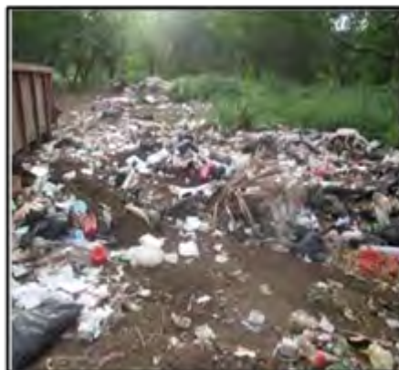
Figura 4. Arrastre de residuos por corriente en invierno

Basabe, A. (2010). Refiere, que la generación de lixiviados en el vertedero es un factor de riesgo muy importante para las aguas subterráneas, por lo que en la fase de diseño y ubicación del vertedero han de desestimarse las zonas con permeabilidad baja o nula.