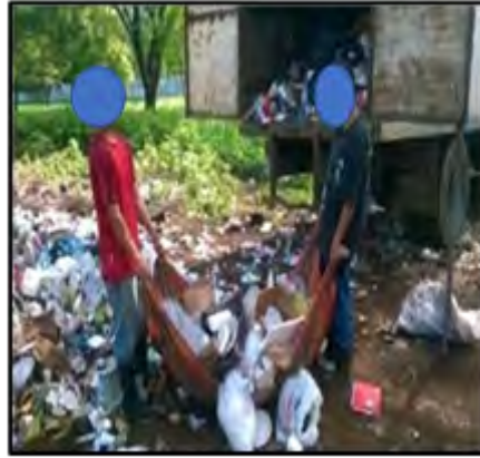
Figura 3. Personal sin equipos de protección e higiene