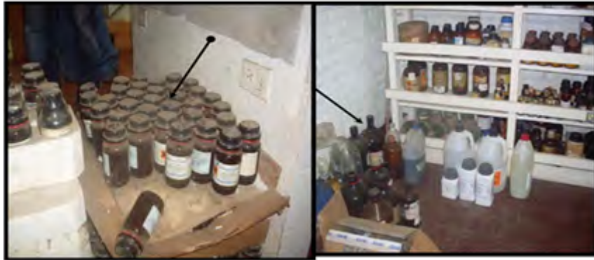
Figura 6. Residuos químicos almacenados

En relación a los Residuos Químicos, los laboratorios están subutilizados, ya que sirven de bodegas temporales, (Figura 6). Basabe, A. (2010). Señala, que, en la gestión de estos, primero se debe evitar la generación, luego se debe recuperar y reutilizar los materiales o realizar intercambios de residuos con otros laboratorios.