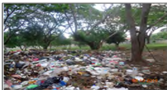
Figura 5. Botadero a cielo abierto, campo de softball, Recinto Rubén Dario