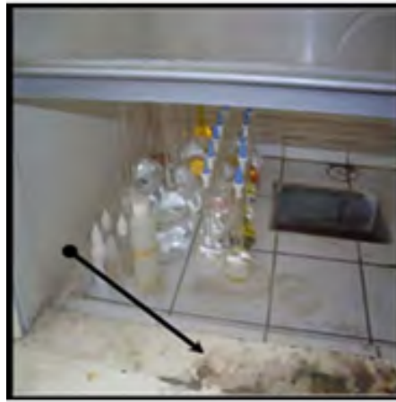
Figura 7. Campana extractora de gases. En al Estado