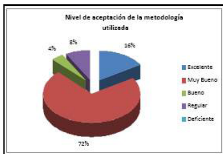
Gráfico 3.-Respuesta a Nivel de aceptación de la metodología (n=26; 1 estudiante ausente)

El gráfico 3 y el cuadro 3 responden a la metodología y calidad de las estrategias. En el gráfico 3, la categoría que más sobresalió fue muy buena; esta respuesta se trianguló con los resultados obtenidos en las tareas de los estudiantes, en plenaria, observaciones en valoraciones del docente, en donde se reflejó que ser facilitador del proceso enseñanza aprendizaje, el uso de estrategias didácticas y formas de trabajo permitió que los estudiantes fueran activos en su aprendizaje. A continuación se muestran resultados en el gráfico.