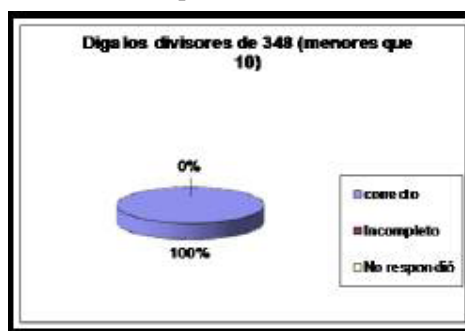
Gráfico 1.- Respuesta a Encuentre los divisores de 348 < 10 y los divisores de 75. (n=10, 5 estudiantes por cada número)

En el gráfico 1 se muestran las respuestas a ejercicios planteados en entrevista sobre el cálculo de divisores de números dados. Valoramos que los mejores resultados se obtuvieron en el número 348 debido a la restricción dada y a la característica de ser número par.