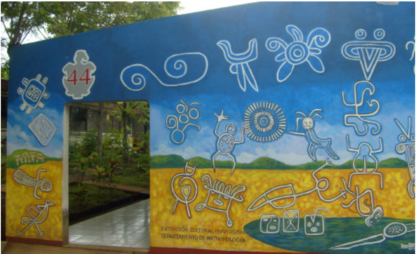
Mural recién pintado, 2007.

Hice un paisaje-escenario organizado en tres franjas: arriba el cielo, en medio el horizonte, abajo la tierra y el agua en forma de lago. Sobre esta base se fueron colocando, diseñando y pintando los diversos gráficos que corresponden a los espacios de cielo como los astros, sol, luna, elementos de la naturaleza como la lluvia, estrellas, orientaciones cardinales, aves y abstracciones geométricas.