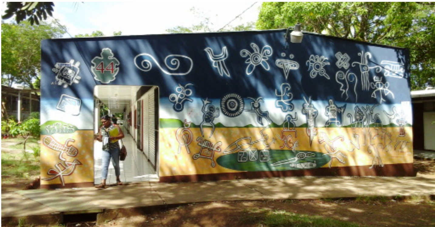
Mural restaurado, 2015.

Foto del grupo fundador en 1993 y del mural en 2007, ambas tomadas por Julio Molina de f2.8.