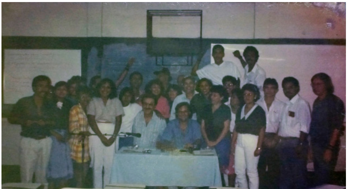
Clausura del curso de Antropología Urbana. UNAN-Managua 1993.

El mural del pabellón 44, en donde se encuentra ubicado el departamento de Antropología de la facultad de Humanidades y Ciencias Jurídicas de la