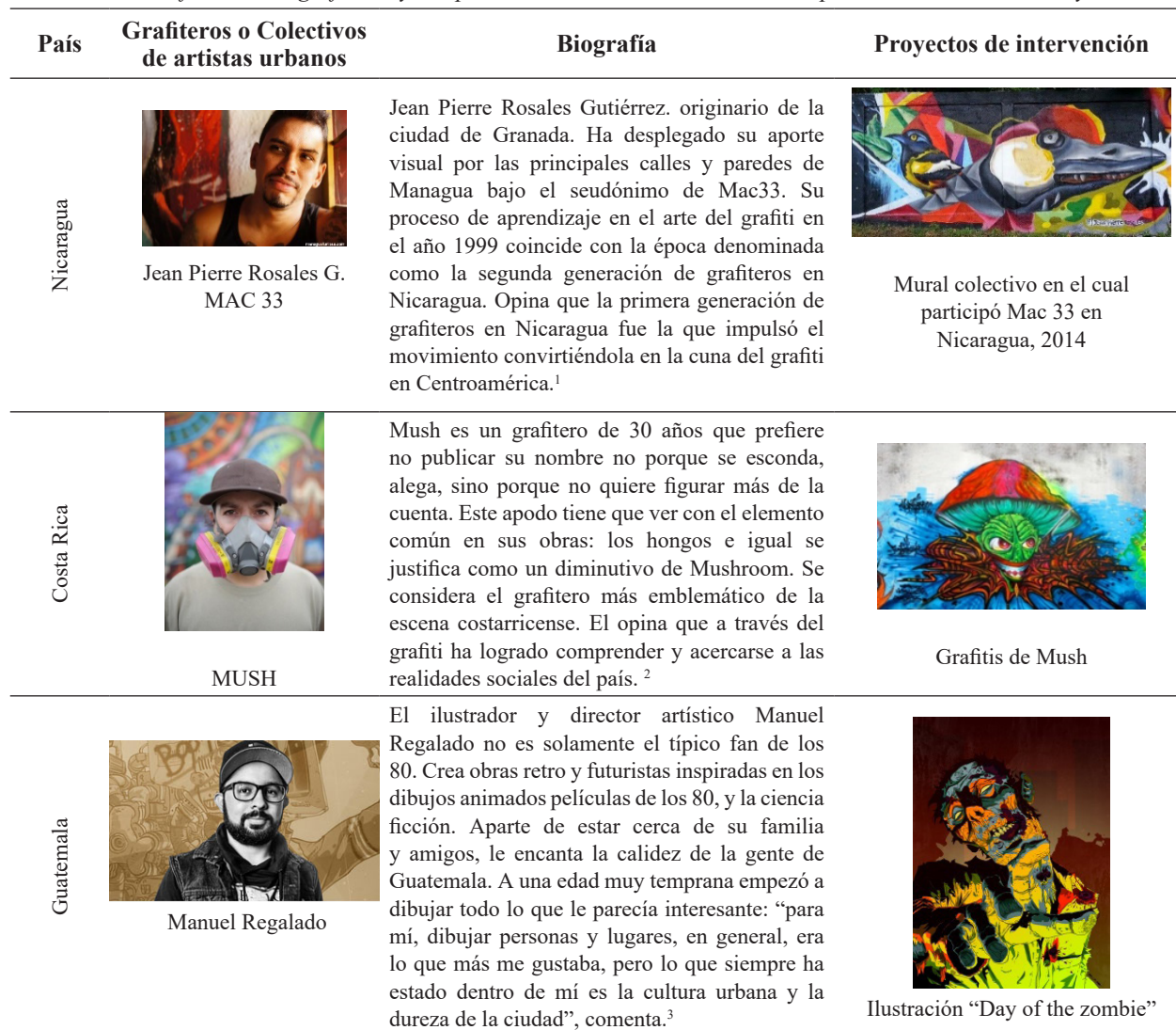
Tabla 2: Identificación de grafiteros y sus procesos de intervención urbana en países de Centroamérica y México

A continuación, se muestra la selección de grafiteros representativos de la zona geográfica expuesta, con el objetivo de evidenciar sus mecanismos de intervención en la imagen urbana y analizar su origen, formación y comportamiento, así como si existe una alineación o contraposición a cualquier regulación existente.