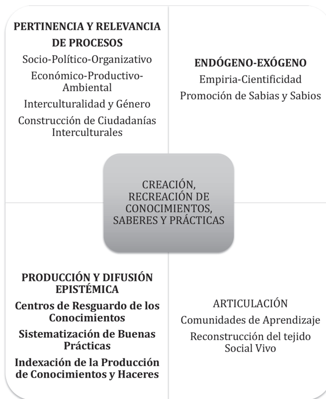
Figura 2: Generación de conocimientos