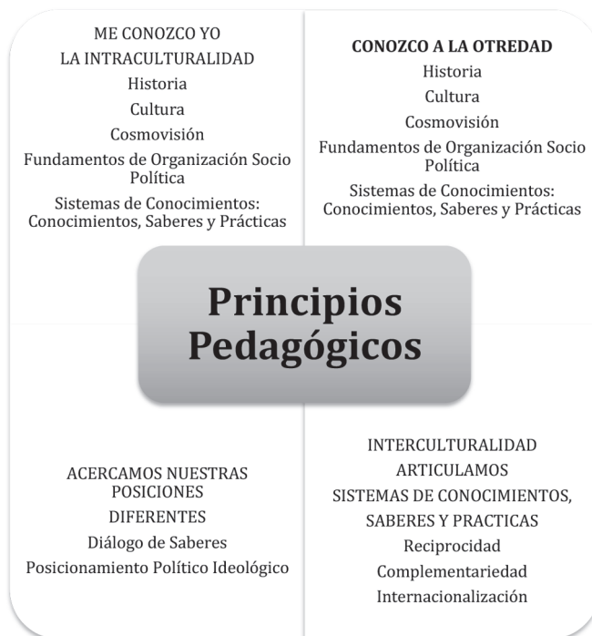
Figura 1: Descolonización educativa.