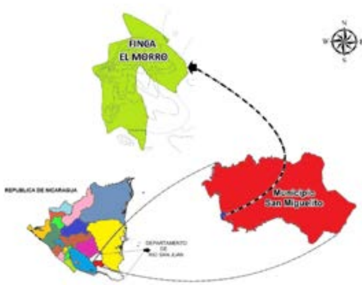
Figura 1. Ubicación de la finca El Morro, San Miguelito, departamento de Río San Juan.