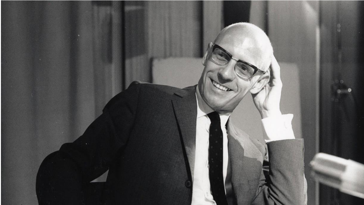
Michel Foucault