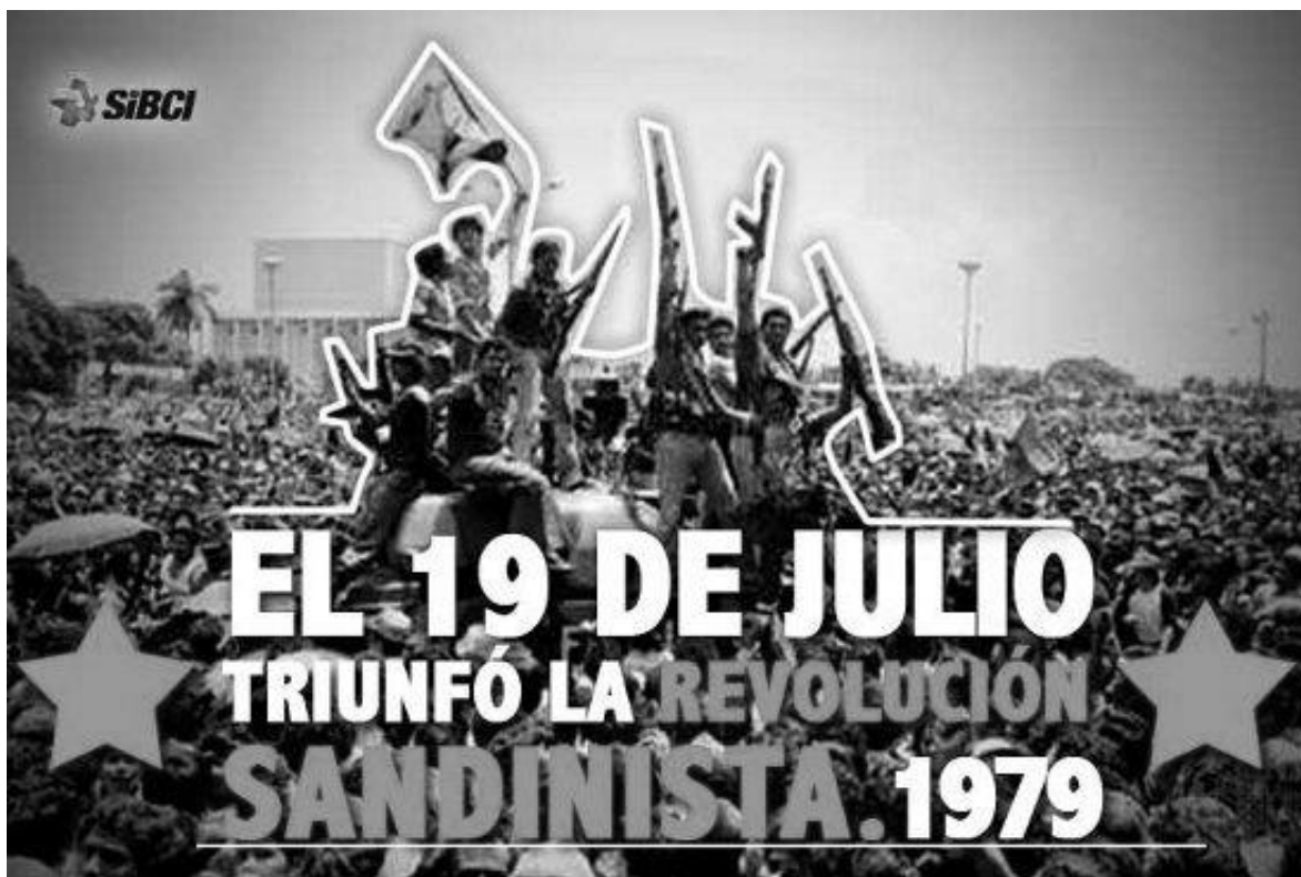
La entrada de la Junta de Gobierno de Reconstrucción Nacional el 20 de julio de 1979.

para legitimar su actuación en contra de Nicaragua como una defensa de los valores fundamentales de libertad y democracia que ellos estaban obligados a proteger.