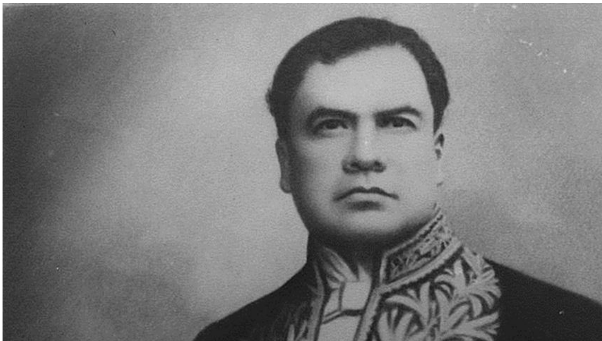
El príncipe de las letras castellanas, Rubén Darío.

utilitarista, pragmatista, expansionista y de capitalismo prefordista, Darío se oponía con una visión de recuperación del vigor de lo que fue el espíritu latino o hispano.