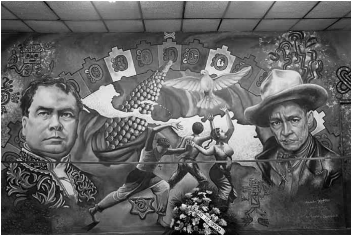
Mural "De Darío a Sandino" del maestro Rolando Bojorge, inspirado en "Oda a Roosevelt" del vate nicaragüense y padre del modernismo. Tanto Sandino como Darío, figuras centrales de la construcción histórica nicaragüense.

Valdría decir pues, que es a partir del Pacto del Espino Negro y la negativa de Sandino a formar parte de la legitimación o aceptación de la presencia norteamericana en Nicaragua, cuando el ensayo y la literatura antiimperialista adquieren un matiz menos benévolo y más bélico. Un matiz que ya no solo puede ser categorizado de patriotismo, como el que todavía sigue acompañando a la época de la Guerra Nacional o incluso de Benjamín Zeledón, sino que la defensa de la soberanía se incorpora como concepto elemental y central dentro de la literatura y el ensayo sandinista.