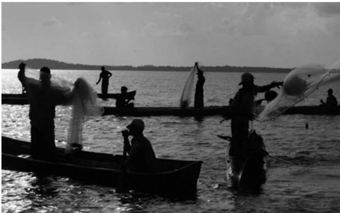
Pescadores en la Laguna de Bluefields.