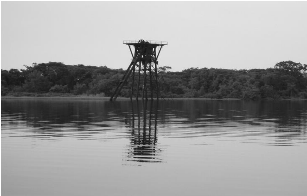
Draga utilizada a finales del siglo XIX en el Río San Juan, por Estados Unidos, al realizar algunas obras para estudiar la viabilidad del Canal Interoceánico. / María Luisa Acosta

ERM ha otorgado al Proyecto la categoría “A”, por los impactos sociales y ambientales adversos, significativos que de éste se puedan derivar y que podrán ser diversos, irreversibles o sin precedentes. 7