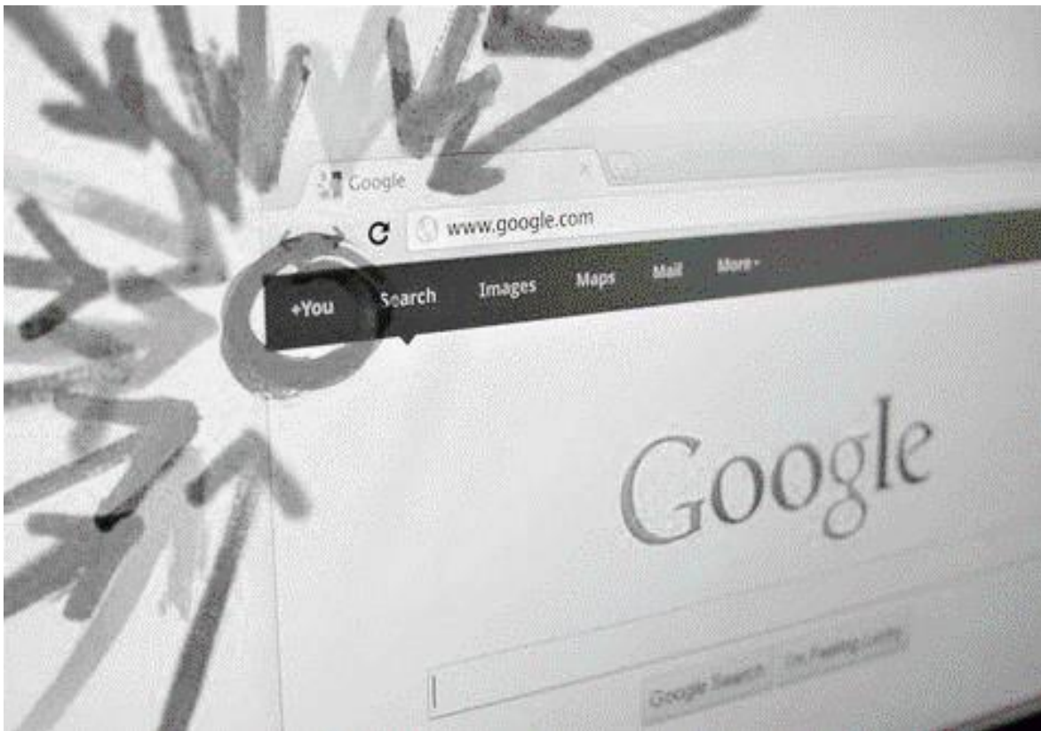
El mundo se contagia del derecho al olvido en internet | milenio.com

El derecho al olvido se define de tres formas: “i) un término ficticio cuyo núcleo es el derecho a acceder, rectificar y cancelar nuestros datos personales que estén en bases ajenas; ii) obligaciones especiales de eliminación de datos financieros y penales después de cierto tiempo; iii) la desindexación de información en buscadores, es decir, que no se elimine la información, sino que simplemente deje de aparecer en el buscador” (Acha, 2015, p. 1).