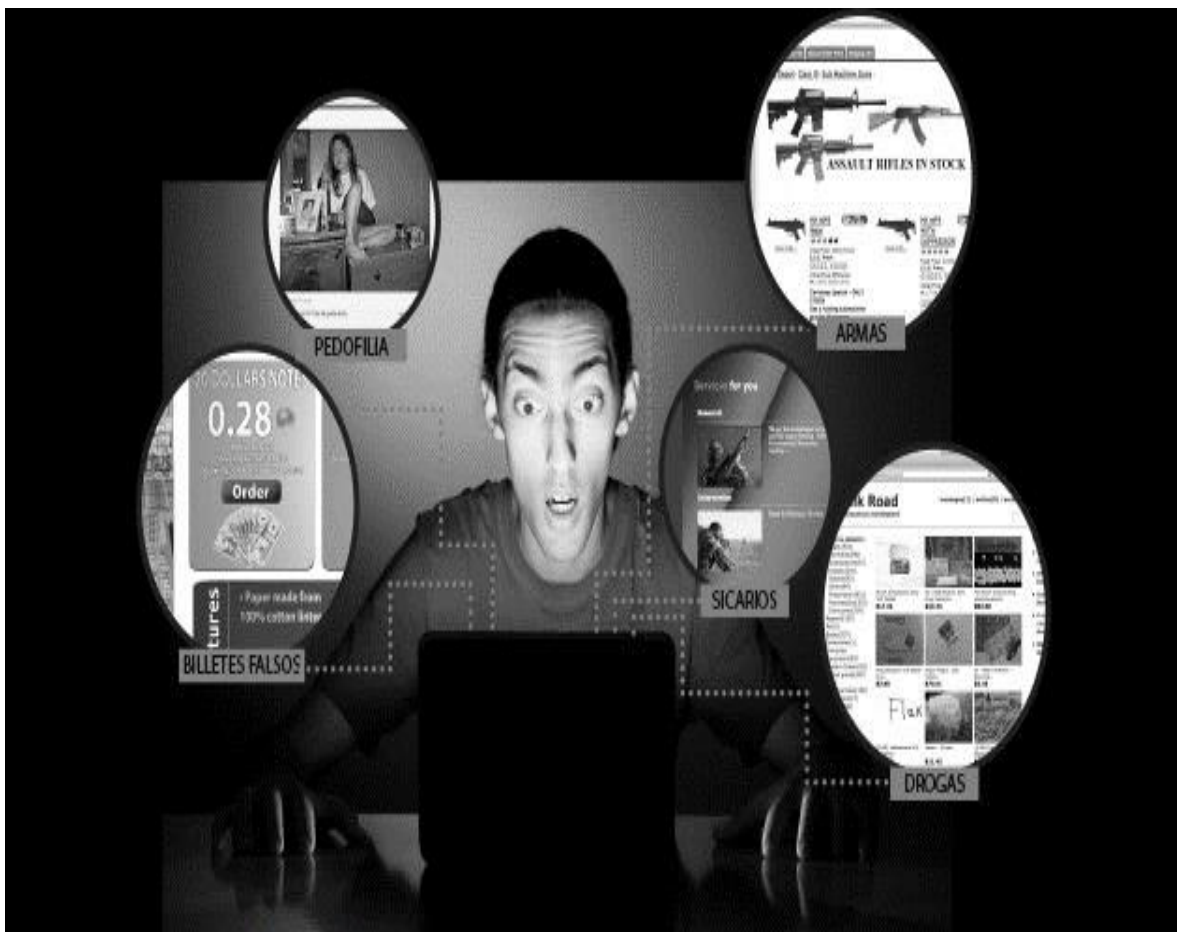
La 'deep web', red de tinieblas

Sin embargo, únicamente representa el 4% de la toda la información disponible (superficial web o web abierta). El 96% restante, está en la Deep Web, también denominada Internet Profunda. La misma que ofrece diversos niveles de información. Entonces, queda claro que accedemos a un porcentaje muy ínfimo de la información que figura en la Red.