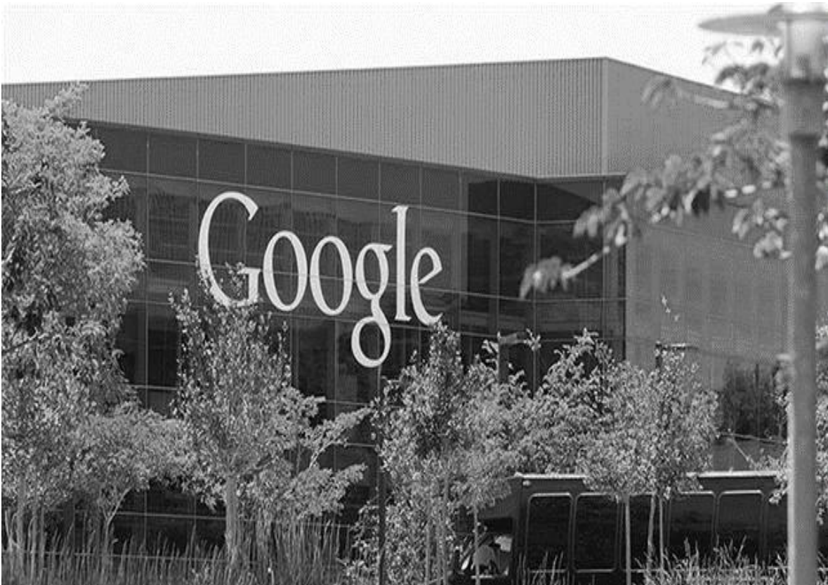
Sede central de Google Inc, California

Ley N° 30024, por la que se crea el Registro Nacional de Historias Clínicas Electrónicas, Ley N° 30096, de Delitos informáticos, Directiva de Seguridad de la Información Administrada por los Bancos de Datos Personales, Ley N° 30171, por la que se modifican los artículos 2, 3, 4, 5, 7, 8 y 10 de la Ley N° 30096, de Delitos Informáticos, y Directiva sobre Tratamiento y Protección de Datos Personales en el Poder Judicial.