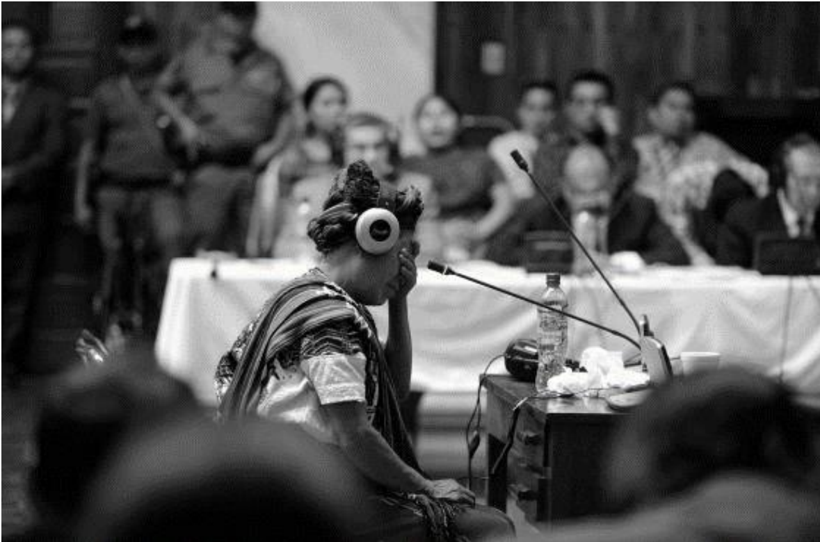
"la [m]odernidad es justificación de una praxis irracional de violencia" (Dussel, 2000, p. 48) / todanoticia.com/

Si la modernidad, tal como lo hemos planteado, constituye un paradigma epistémico surgido de una praxis conquistadora que justifica y racionaliza la superioridad de Europa y la inferioridad de las demás regiones, ¿las universidades pueden seguir sosteniendo su base estructural en el marco de esta modernidad sin criticar a este mismo sistema del que se nutre? ¿Las universidades pueden continuar pensando que sus logros están producidas por lo moderno? ¿Puede haber un divorcio entre universidad y paradigma moderno? Son dilemas difíciles de superar, pero no difíciles de contestar. Nuestro primer objetivo es deliberar cuáles son los aspectos de este paradigma moderno que atraviesan a la universidad.