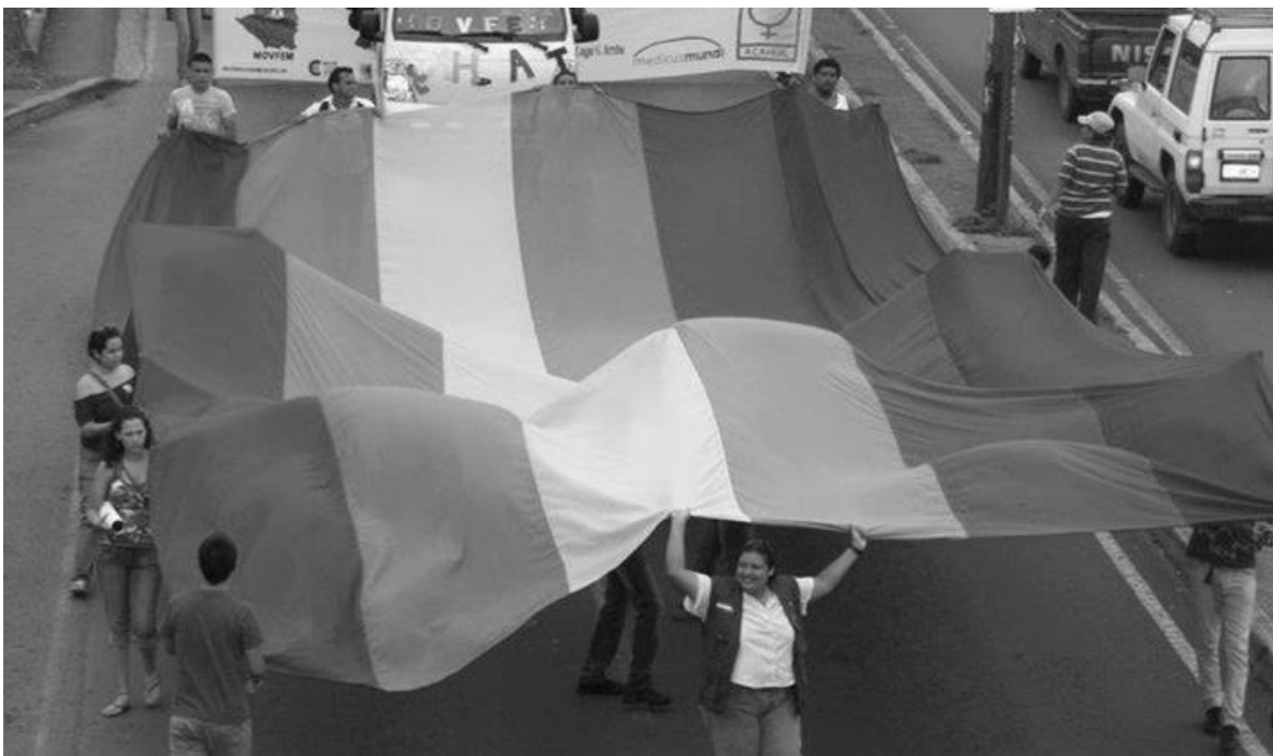
La procuradora Montiel (al frente) en una manifestación LGBTI

Yo soy muy cuidadosa cuando me dicen es que el Estado no está haciendo propuestas públicas para la comunidad LGBTI: insisto, yo no miro el rótulo de neón ahí, pero si veo que nos están dando respuesta, veo más consciencia en la Policía Nacional para tratar estos temas [...] veo [trabajando] a la justicia, porque todos estos casos que yo te mencioné no han quedado impunes. Entonces si no tengo impunidad, significa que estoy teniendo justicia.