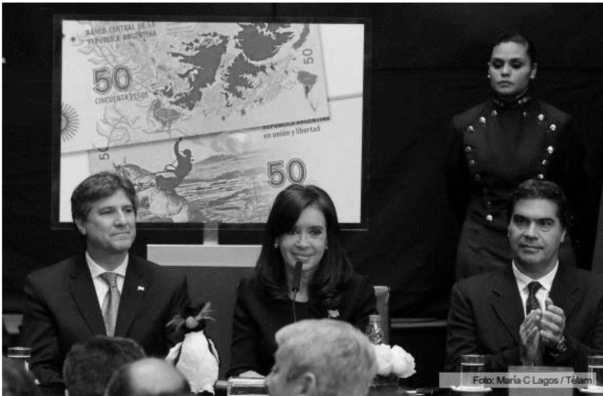
Cristina aseguró que las Malvinas hoy "son la base militar nuclear de la OTAN en el Atlántico Sur" | Telam.com.ar

definitivamente en el Atlántico Sur con objetivos geo-políticos y militares de clave colonial. Más aun considerando que los antecedentes de esta organización no han sido especialmente pacíficos.