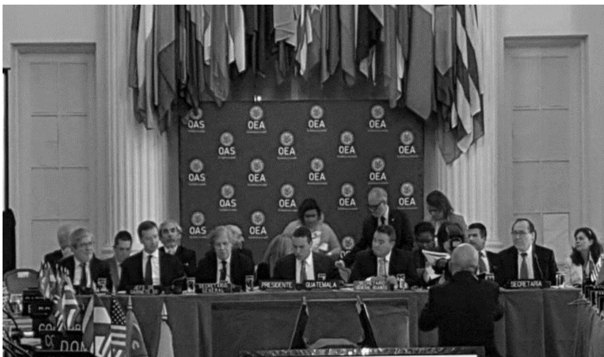
OEA solicitó a Argentina y Reino Unido retomar negociación de las Malvinas | segundoenfoque.com

Como se menciona en la introducción, esta dinámica de “control británico-reclamo argentino”, sólo se vería interrumpida entre abril y junio de 1982, cuando el ejército argentino ocupa las islas y se desata la guerra de Malvinas. Este nefasto episodio de la historia fue una bisagra en la cuestión de Malvinas, en primer lugar por su repercusiones en la relaciones entre ambos países que se vieron fuertemente erosionadas; en segundo lugar por el impacto en la política interna tanto de Argentina [con una sangrienta dictadura cívico-militar que atravesaba una profunda crisis económica y de legitimidad] como del RU [donde la guerra significó un valiosa oportunidad para elevar la popularidad del gobierno de Margaret Thatcher que era fuertemente cuestionado por varios sectores de la sociedad].