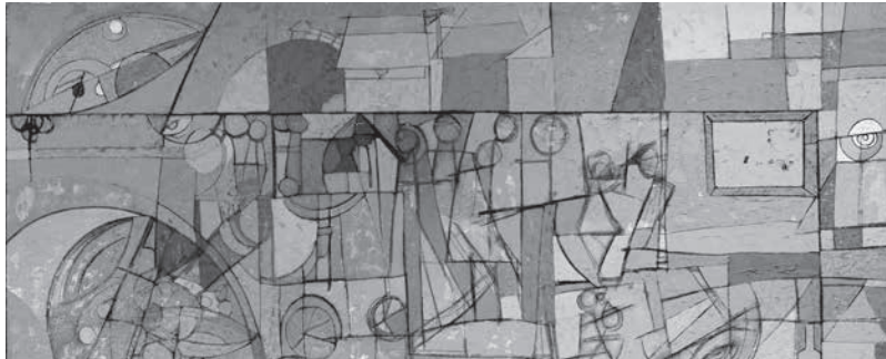
Autor: Arnolkis Turro

Recibido: 10 de febrero de 2014/ Aprobado: 29 de marzo de 2014