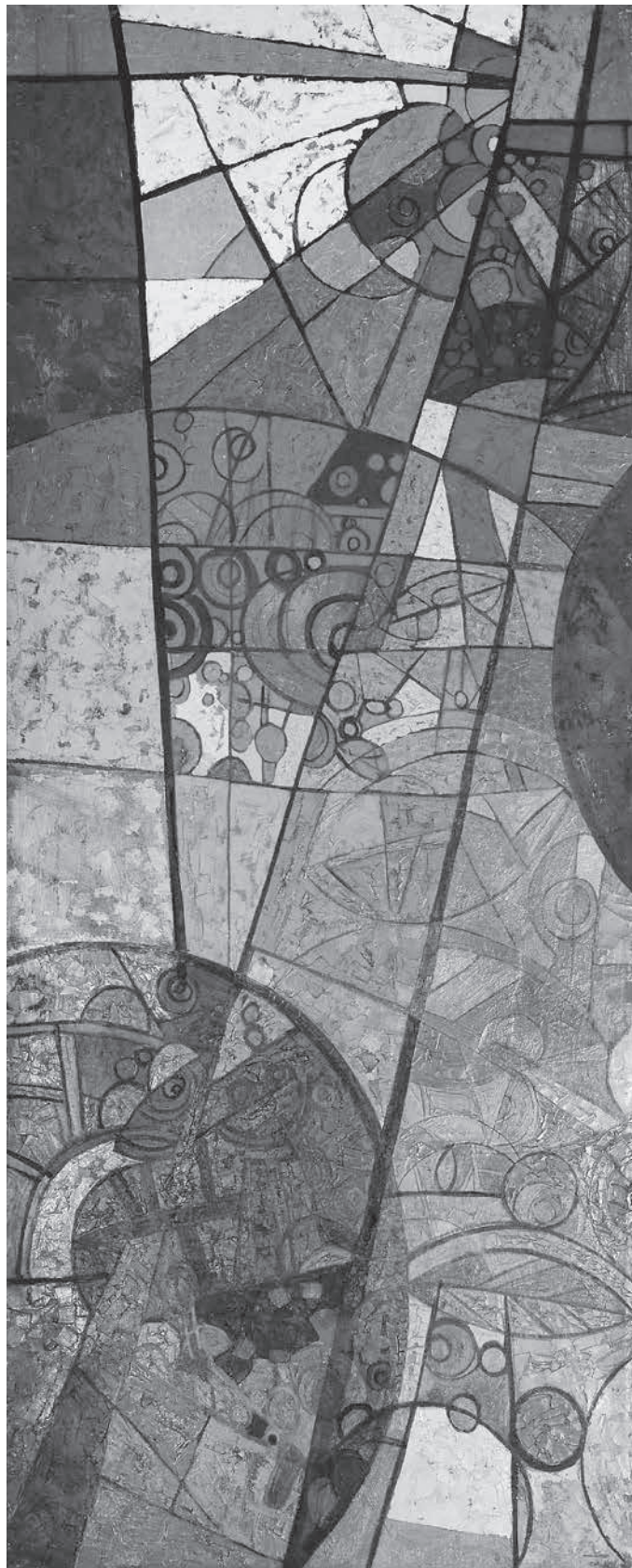
Autor: Arnolkis Turro

En el momento que intentamos la aprehensión, intelección o comprensión de la obra de Turro, pasamos a la mirada de los diversos planos de detalles y encontramos el fluir de lo real atrapado en la belleza de las formas geométricas expresadas con la calidez o frialdad de los colores.