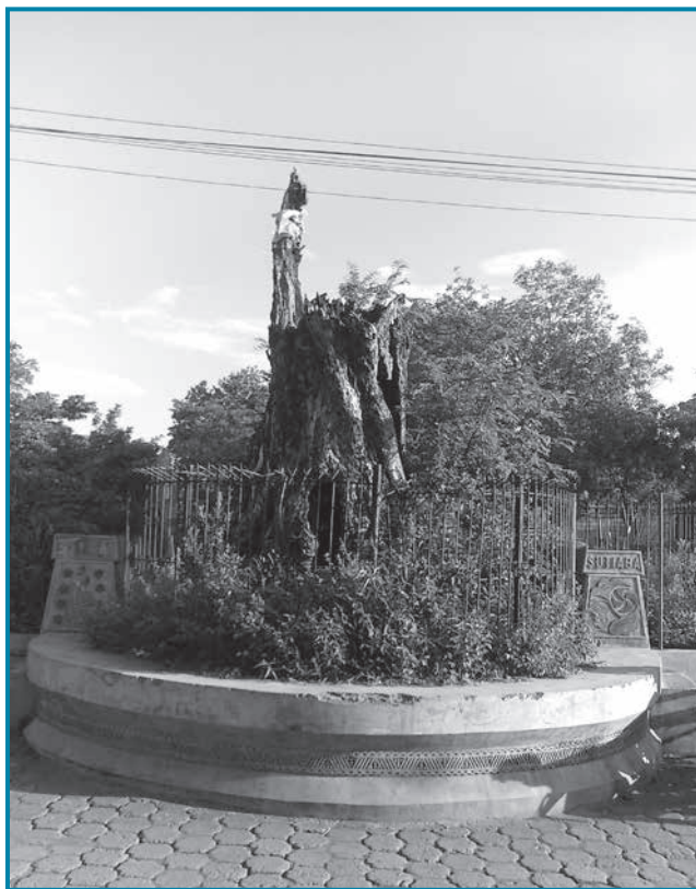
Monumento del Tamarindón de 1935

Estos hechos debieron ser patéticos en el pueblito de Çigüina, que dotado de sus propias relaciones de parentesco, quedó aterrado por la misma acción de conquista y salvajismo que aquel cristianismo allí llevó, y debieron representar esos hechos un acontecimiento tan desgarrador y una afrenta tan