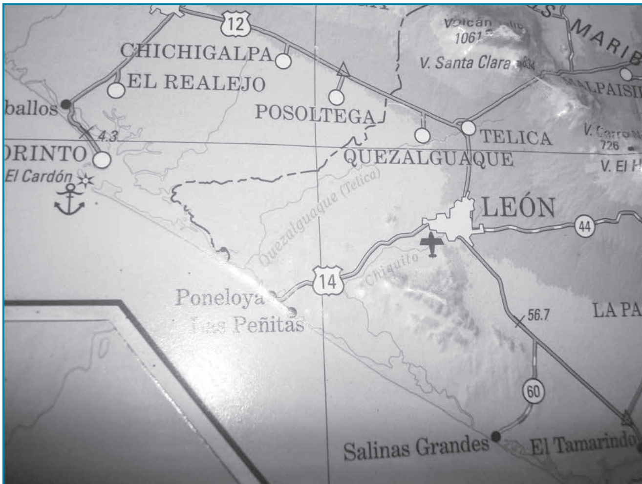
Mapa de León - El Realejo

De modo que, planteada la existencia de un texto literario, tardío, del año 1936, se podría considerar válido el criterio de JEA como hipótesis de trabajo y suponer que los indígenas de Sutiaba tomaron del texto de Macías Sarria el mito y lo trasladaron a su oralidad y cultura; lo que, en todo caso, bien sería una legítima acción de apropiación cultural o de simple revival 10 . Ahora bien, ante la ausencia de otros estudios que proporcionen información respaldando esta hipótesis de JEA, habría que agotar, para validar esa tesis, todas las fuentes disponibles, recurriendo al análisis de los recursos documentales existentes, para revalidar o para rechazar esa hipótesis, principalmente las fuentes coloniales. Algo que no se ha hecho antes y limita por ende asegurar que “Xochitl” y “Adiact” no tengan existencia histórica y sino literaria. En aras