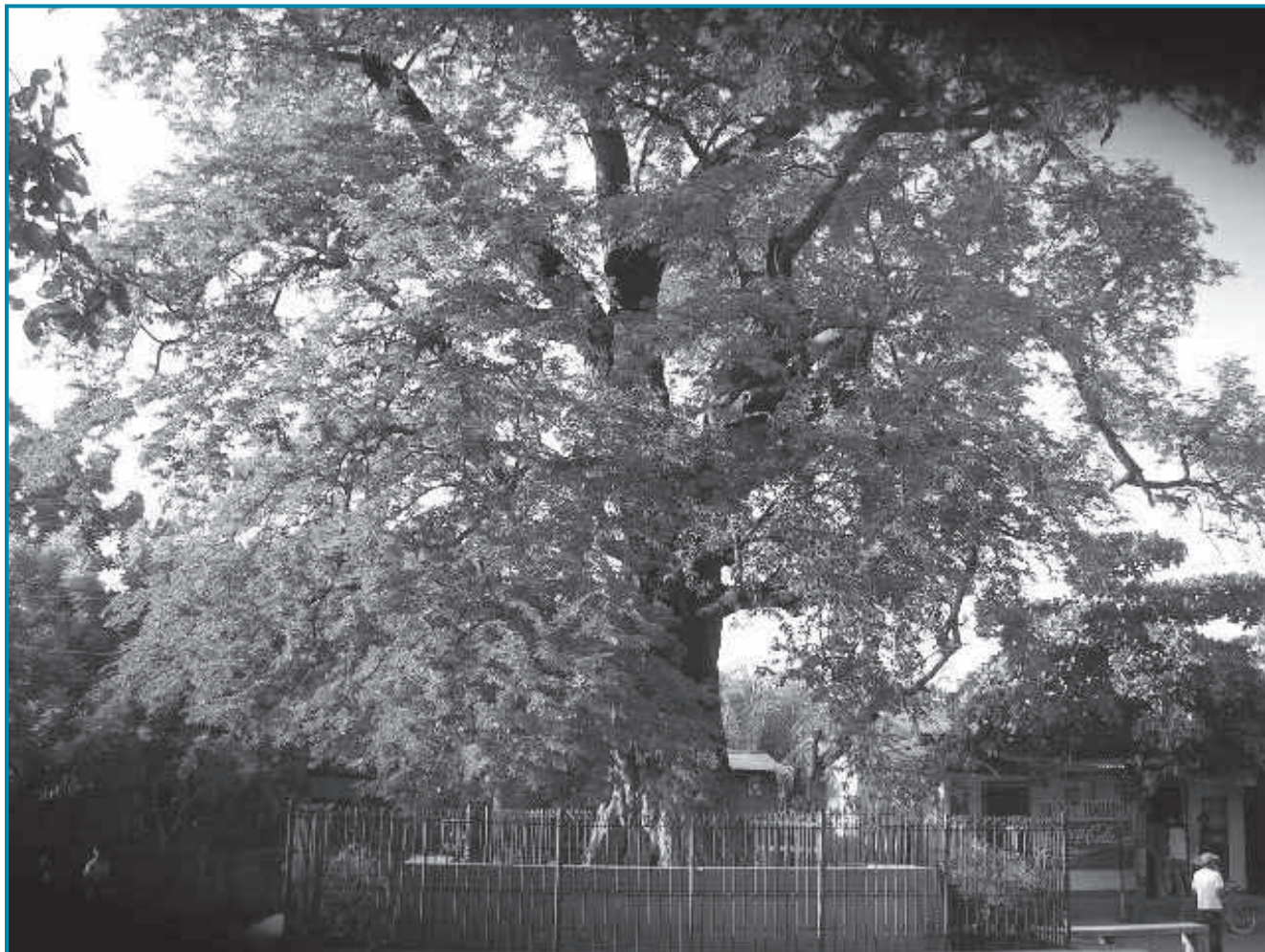
Tamarindón en vida