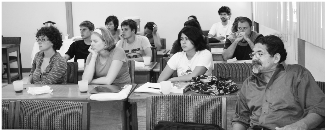
Estudiantes de universidades norteamericanas recibiendo curso de Cultura de Paz, impartido por docentes del Instituto "Martin Luther King"-UPOLI.