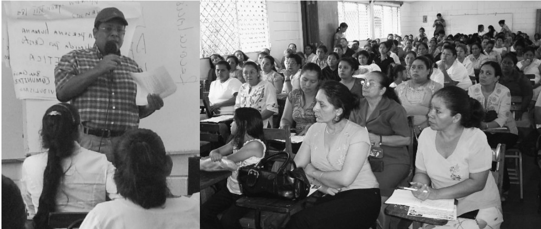
Segundo Taller sobre la Iniciativa Mundial de Reconciliación 2009, impartido por el Instituto "Martin Luther King" de la UPOLI, a más de 100 mujeres dirigente de distintos sectores productivos y sociales de Nueva Guinea.