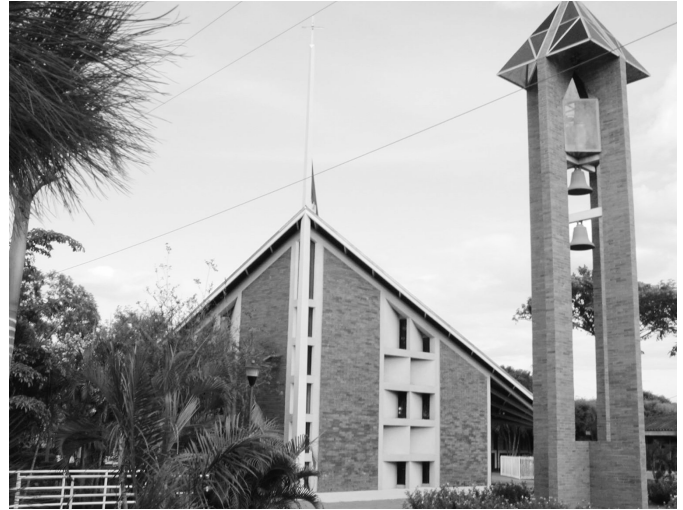
Capilla y Campanario de la UPOLI.

para la diseminación y aplicación de la Política Institucional de Equidad de Género.