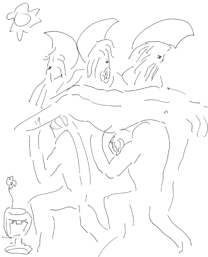
Autor: Gabriel Traversari, título: "Batalla de maratón".

El Tratado de no Proliferación Nuclear requiere la prohibición y la eliminación verificable de las armas nucleares. Los Estados armados nuclearmente no han cumplido con estas obligaciones de desarme nuclear. Deben ser llamados por la comunidad internacional para que rindan cuenta y obligados a actuar responsablemente. En los últimos dos años varios movimientos están trabajando para prohibir y eliminar las armas nucleares. Tres conferencias internacionales de Estados en Oslo, Nayarit y Viena proporcionan gran parte de la prueba pericial que ahora se ha resumido y presentado a la Conferencia de examen del TNP de 2015, y a la 70 sesión de la Asamblea General de la ONU como la base humanitaria para el desarme nuclear.