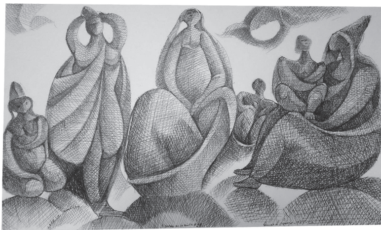
Autor: Omar d'León.

Cuando los fundadores de la Unesco se referían a las guerras, lo hacían refiriéndose a la violencia en su más alto nivel de crueldad y daño humano, no obstante, la violencia como sinónimo de una relación social precaria e inacabada, está presente, implícita o explícitamente donde dos o más seres humanos se juntan. En el interior de las familias. En los centros educativos. En los centros de trabajo. En las paradas de buses, las calles y los barrios. Por ello es que, cuando los fundadores también se referían a que es en las mentes de los hombres donde se deben levantar los baluartes de la Paz, con ello también afirmaban que es en la mente de los hombres donde hay que enseñar a “aprender a convivir”. Sembrar semillas de convivencia para cosechar paz. La siembra de la paz en todos los espacios en donde se juntan y reúnen hombres y mujeres, jóvenes, niños y niñas.