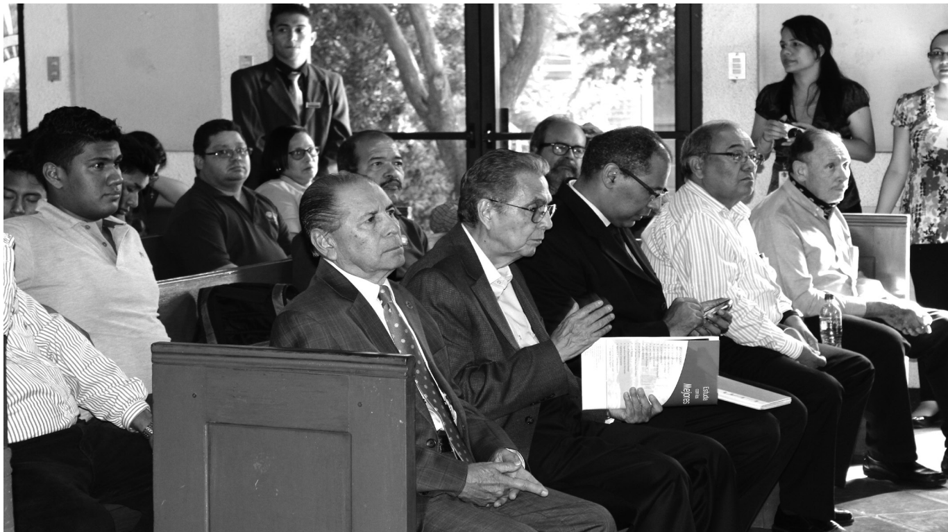
R. Públicas UPOLI.

histórica del ser latinoamericano. Liberación que se expresa en la posibilidad de reafirmar lo propio, en la capacidad de creación. (§ 3, p. 142, 2. Prolegómenos a una teoría del ser latinoamericano , ENI).