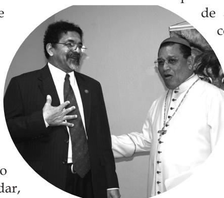
Rev. José Miguel Torres h. y Su Eminencia Reverendísima Cardenal Miguel Obando y Bravo.

En el marco de la planeación estratégica de la UPOLI a que fue convocado el liderazgo de la Universidad por las autoridades superiores, en una continuación de los primeros pasos de planeación estratégica que tuvo la UPOLI, a partir del año 1991 y que determinó el primer Plan Estratégico de Desarrollo Institucional para el periodo 1999-2003, con énfasis en el área académica, se tuvo en mente el propósito de revisar, validar, o redefinir y reorientar el quehacer de la Universidad para determinar el mejor rumbo a seguir en los escenarios posibles o necesarios del futuro de corto y mediano plazo, tarea ésta