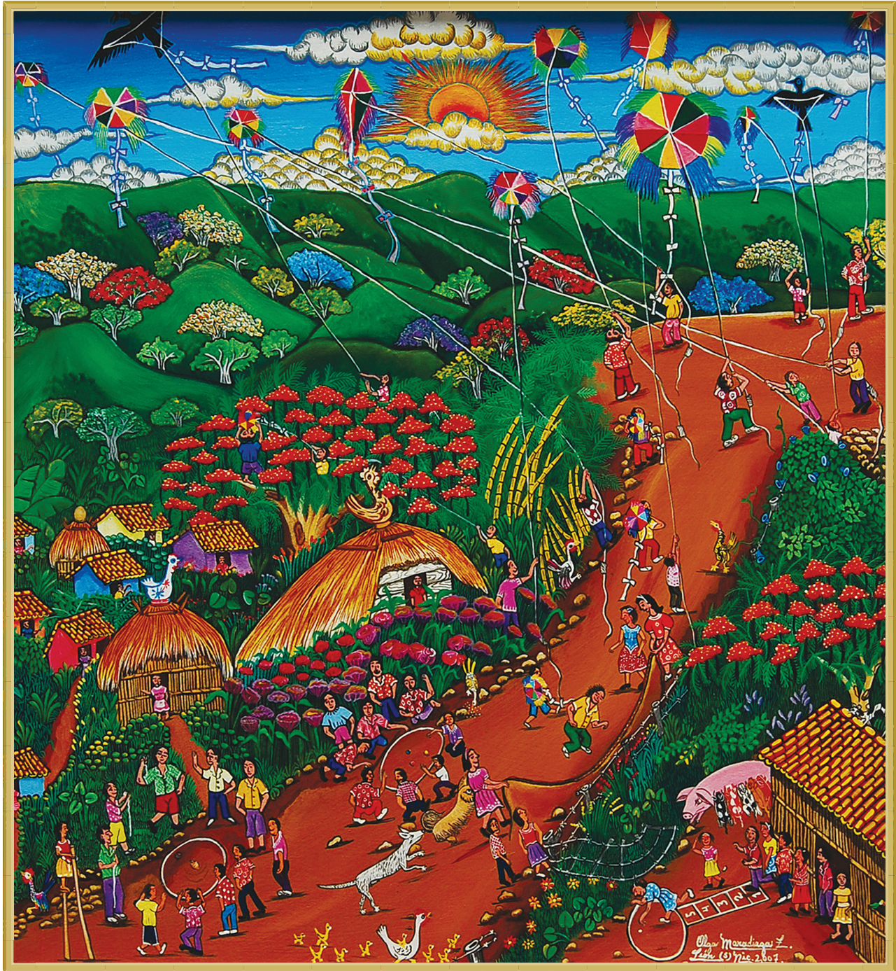
Título: "Juegos tradicionales de Nicaragua", Técnica: Oleo sobre tela, Fotografía: Galería Praxis.