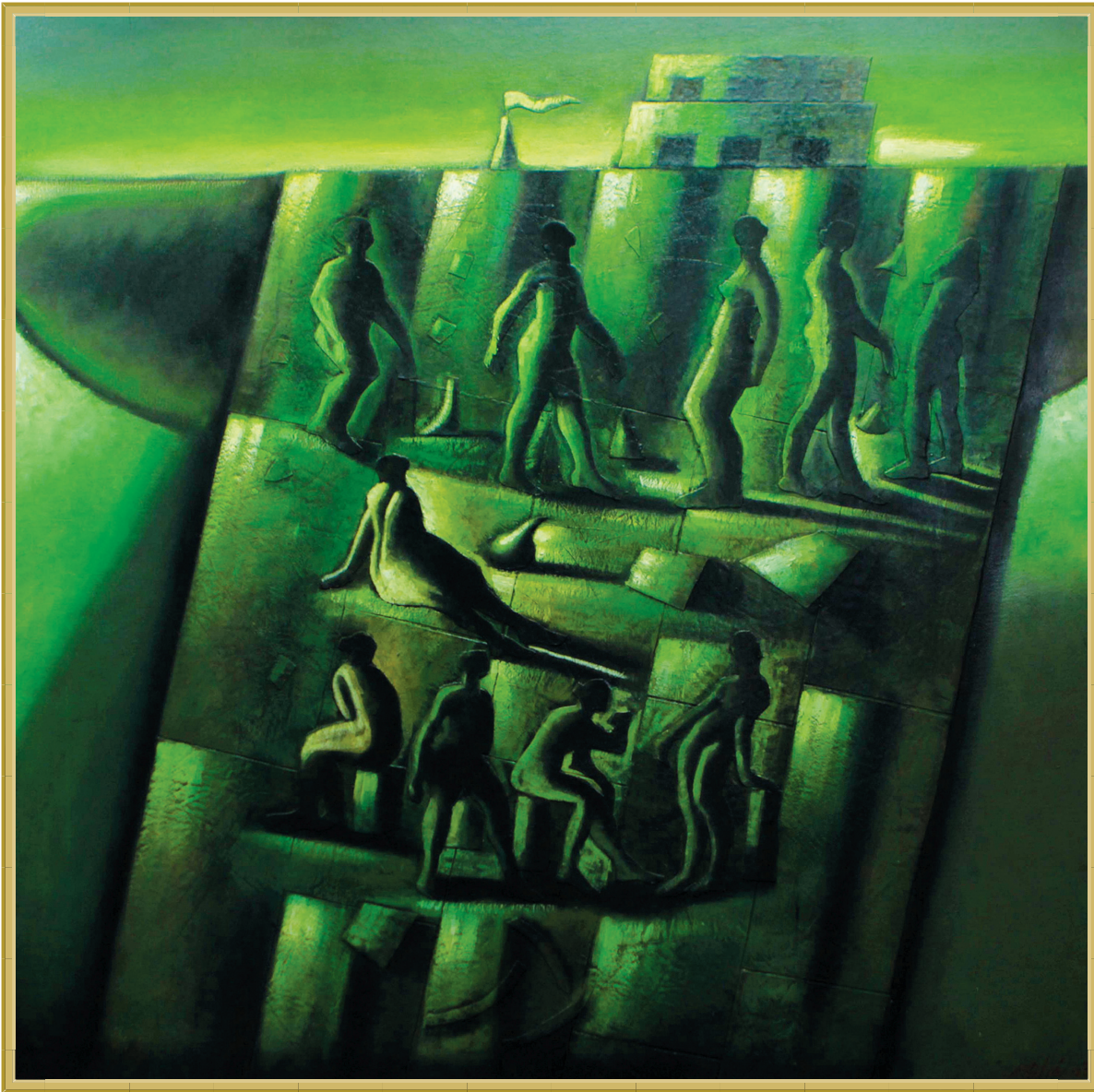
Título: "Reunión en la Plaza", Técnica: Oleo/tela, Medidas: 1.30x1.30 mts., Año: 2012, Fotografía: Lenín Munguía.