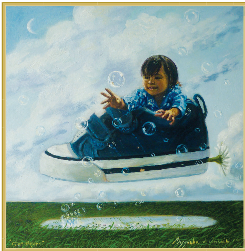
Título: "Mi bella flor", Medidas: 20 x 20 cms. Técnica: acrílico s/panel, Año: 2010