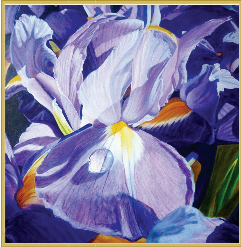
Título: "Iris violeta y gota de agua", Medidas: 60 x 60 cms. Técnica: acrílico sobre lino, Año: 2012