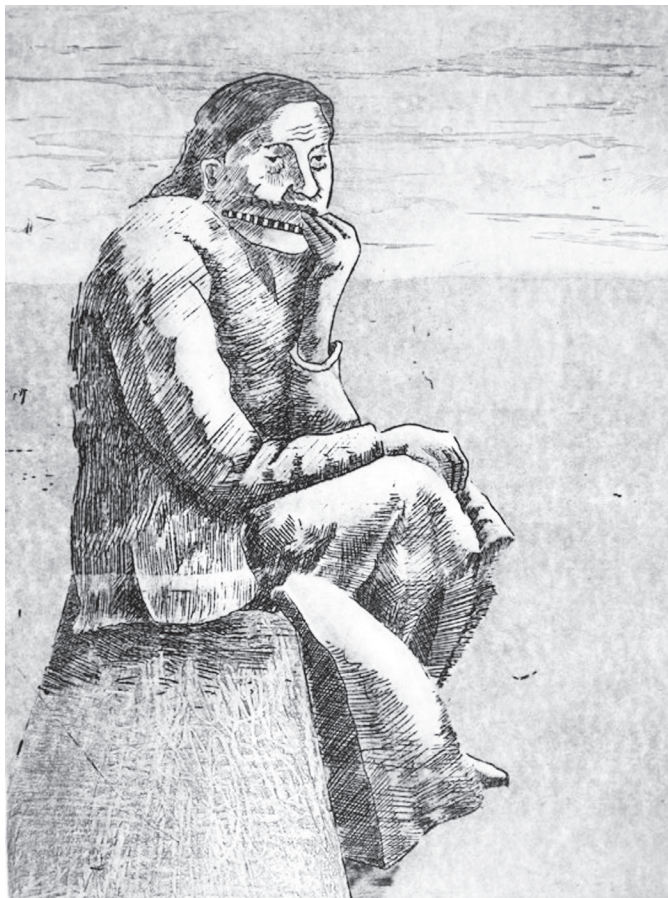
Autor: Mario Madrigal Arcia.

exterioridad , que es su expresión corporal. Ni solo interioridad , que es su universo psíquico interior. Está dotado también de profundidad , que es su dimensión espiritual.