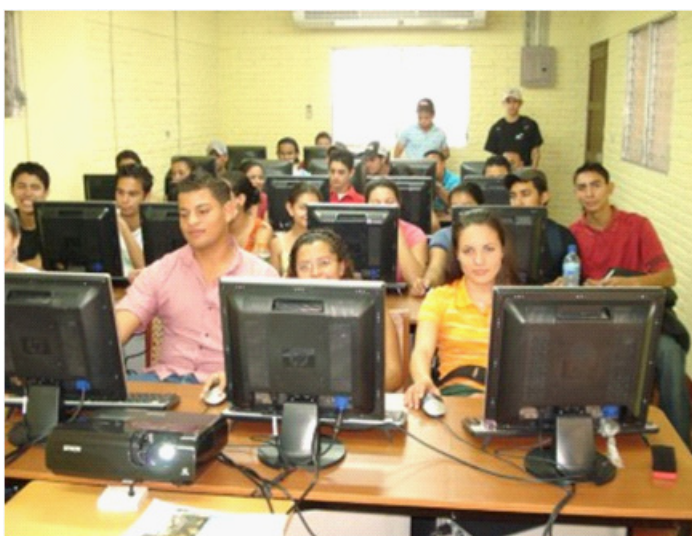
Laboratorio B de Cómputo UNI - Norte