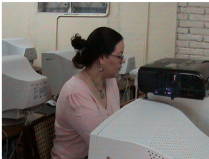
Docente UNI Norte utilizando computadora Laboratorio A

Innovación educativa, Santiago de Compostela, 2002, ISBN 00-820-0330-038