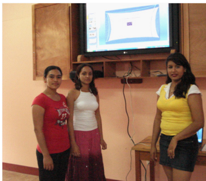
Estudiantes de UNI Norte realizando exposiciones en Aula con medios AudioVisuales.