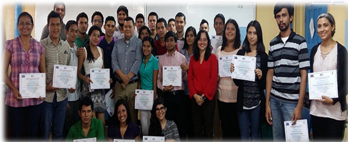
Figura 4: segunda generación de emprendedores 2016

Para la segunda cohorte del curso, se convocó de la misma manera, abierta, masiva, a través de canales de comunicación antes mencionados, sin embargo, se tuvo la particularidad de que el grupo meta para esta experiencia fueron estudiantes de segundo, tercer y cuarto año, así como personal docente y administrativo de FIQ que deseaba participar, de igual manera se extendió la convocatoria a público en general. Se graduaron 45 participantes.