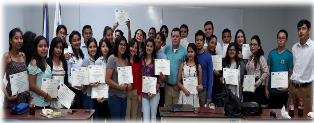
Figura 5: tercera generación de emprendedores 2017

Dado que el emprendimiento es meramente actitudinal y vivencial, otro aspecto diferente de esta tercera generación fue el hecho de contar con diferentes expositores de experiencia en el emprendimiento que hicieron presentaciones de media hora, mostrando sus diferentes vivencias emprendedoras, compartiendo los aciertos y desaciertos que han enfrentado en el mundo complejo del emprendimiento Nicaragüense.