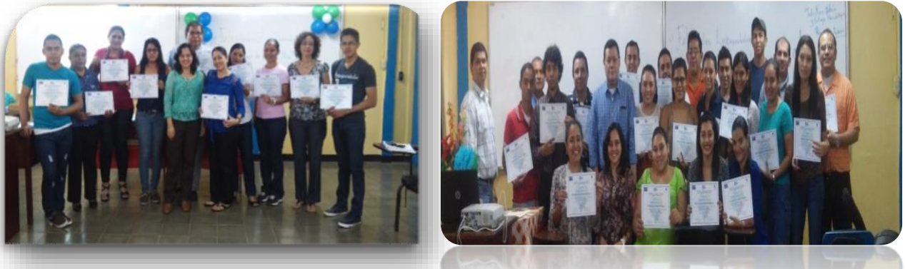
Figura 3: primera generación de emprendedores 2015

La primera cohorte se desarrolló a partir de septiembre de 2015, se convocó a estudiantes de cuarto, quinto año, egresados y personal docente y administrativo, siendo la primera vez que se vivía experiencias de esta manera en la que se organizaban grupos heterogéneos de participantes. La respuesta fue masiva a la convocatoria, contando con la participación de 65 personas.