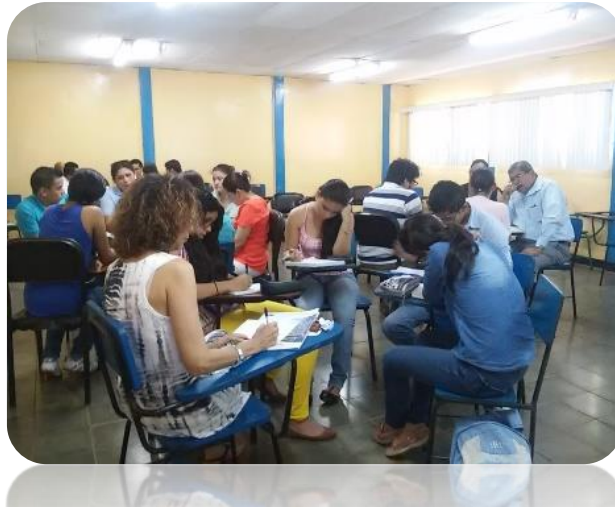
Figura 2: Trabajo en equipo los estudiantes participantes