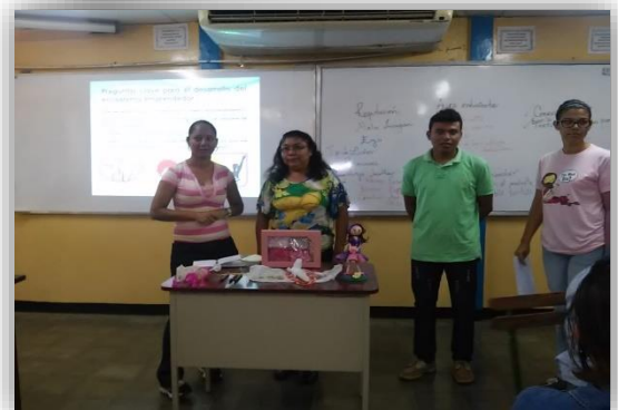
Figura 3: Presentación de trabajos realizados.