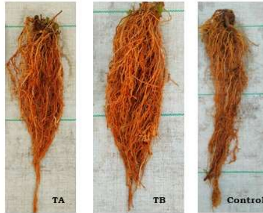
Figura 1. Se muestran las raíces del TA= Tratamiento A; TB= Tratamiento B y el control