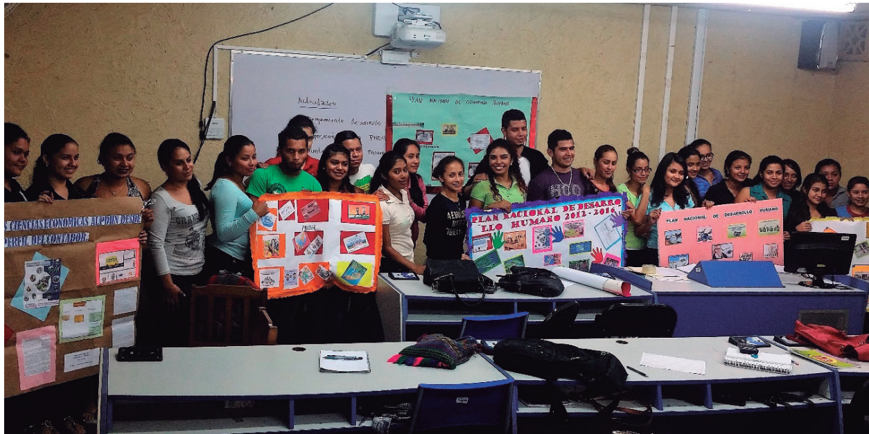
Ilustración 1: Estudiantes de IV año de Contaduría Pública y Finanzas, nocturno, grupo B. Foto tomada por la MSc. Arlen Picado Juárez, septiembre 2016

Los comentarios de los estudiantes fueron: les gustó mucho la actividad realizada, pudieron observar la creatividad en cada mural, también expresaron que los compañeros que explicaron en los murales tenían conocimientos y daban ejemplos los cuales les permitía afianzar la teoría dada.