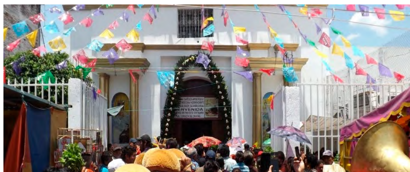
Imagen 3. Recorrido de San Pascual

En la procesión participaron los danzantes denominados como parachicos, procedentes de Chiapa de Corzo, también varios grupos de bailarines de Tuxtla Gutiérrez, unos traían vestidos regionales, otras máscaras de personajes de cuentos de hadas, de brujas, de payasos diabólicos, de monstruos, todos bailando al son del carrizo y del tambor. Por último, a las 18 horas inició el Santo Rosario, ritual con el que finalizó la fiesta patronal 2015 (Ver Imagen 3).