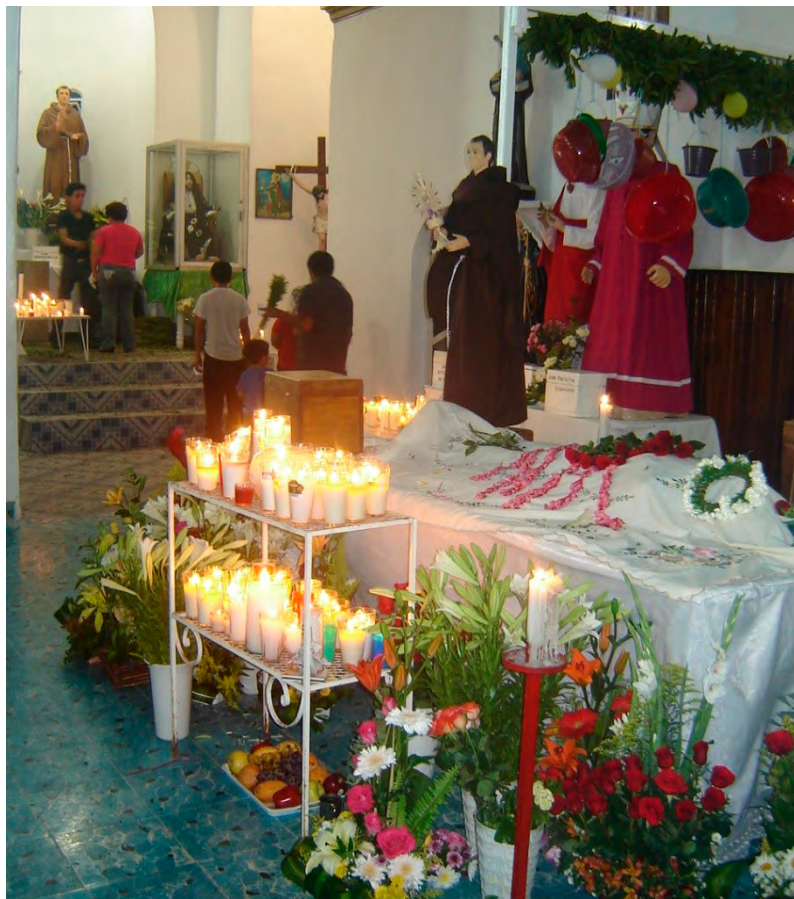
Imagen 1. San Pascual en el atrio de su templo

Al mismo tiempo que se retiraban los miembros de la Mayordomía y Priostería de Tuxtla Gutiérrez, fray Rogelio Carrillo Hidalgo instruía a sus colaboradores para que procedieran a abrir las puertas del templo. En las inmediaciones del recinto había un poco de gente que esperaba ansiosa el momento para pasar a venerar al santo huesudo. Si bien, son días de fiesta, también son de guardar, puesto que es el único día del año en que está expuesto al público el esqueleto de San Pascual Bailón, lo que ocasiona que mucha gente se reúna a orar en el templo. En el transcurso del día, prosiguieron llegando a la iglesia de San Pascual feligreses de todas las clases sociales, unos con mayor tiempo de estadía que otros, pero sin duda con una gran devoción al santo esqueleto. La mayoría de los fieles compraban su albahaca para su tradicional rameada, aunque algunos otros preferían que les hicieran un su conjuro 12 (Ver Imagen 1).