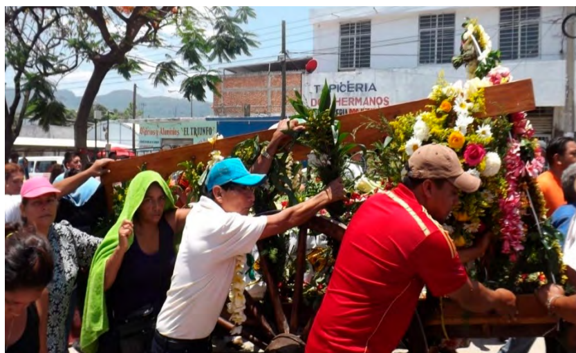
Imagen 2. Recorrido de San Pascual

Eran las 11 y minutos de la mañana, cuando los cientos de feligreses comenzaron la peregrinación por las calles céntricas de Tuxtla Gutiérrez. Cuando llegamos al panteón municipal –lugar donde se hizo un descanso de media hora– la gente estaba muy cansada, pero no renunciaban a seguir jalando la carreta. Esta fue empujada durante poco más de cuatro horas por mujeres y hombres que se intercambiaron de posición dependiendo de su fatiga y de la penitencia. Los devotos en su mayoría fueron acompañados de familiares y amigos, algunos llevaban a sus críos vestidos de San Pascual Bailón, por lo que la túnica franciscana para esas creaturas, más que un honor fue un martirio, puesto que durante el recorrido hubo más de 40 grados de calor (Ver Imagen 2).