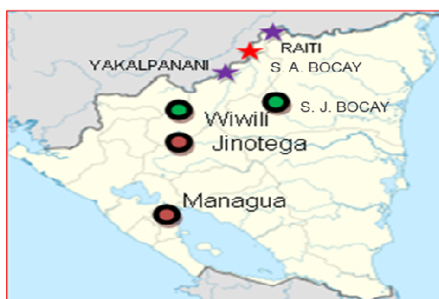
Imagen 1: Ubicación en el mapa de Nicaragua la comunidad Indígena de San Andrés de Bocay.

Técnicas e instrumentos: Se revisaron documentos, visitas y recorridos por la comunidad, entrevistas a dirigentes, dos grupos focales y encuesta. La participación de los ciudadanos fue voluntaria y se realizó una pregunta central: ¿Principales estrategias de supervivencias, socioeconómicas empleadas en las últimas dos décadas por los comunitarios indígenas? La información brindada fue analizada, ordenada, procesada en programas de office de forma adecuada y ubicada en el desarrollo de los resultados.