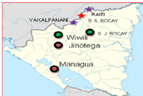
Imagen 1: Ubicación en el mapa de Nicaragua la comunidad Indígena de San Andrés de Bocay.