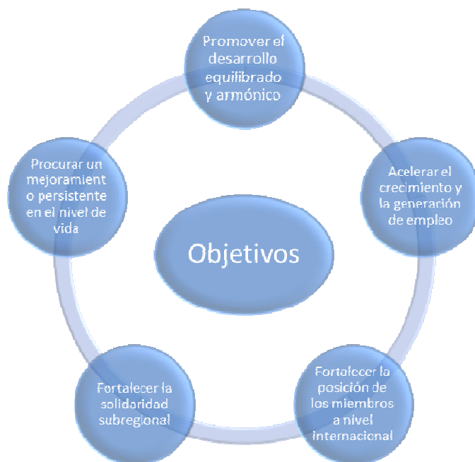
Figura No. 1: Objetivos de la CAN