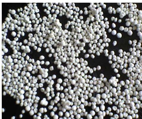
Figura 3. Microcápsulas de diclofenac secas.