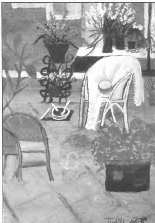
"The Beranda", Judith Kain.