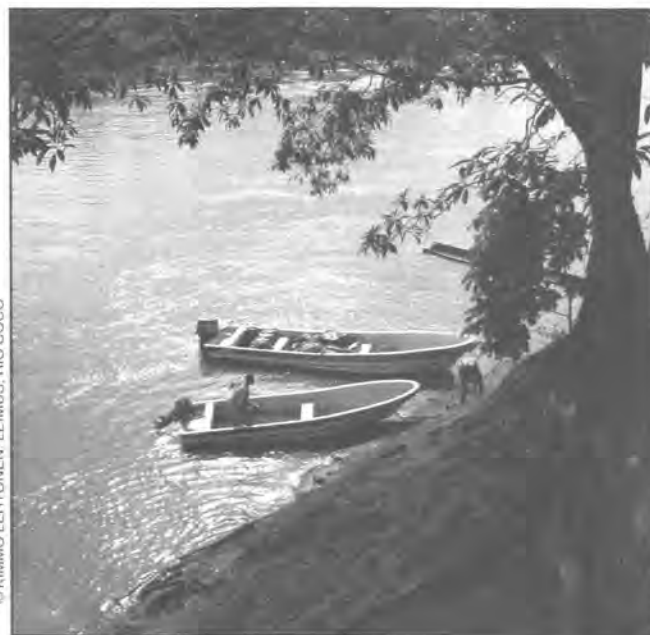
© KIMMO LEHTONEN, LEIMUS, RÍO COCO