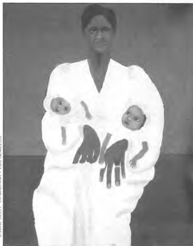
© JUNE BEER. "LA MADRINA Y LOS GEMELOS"