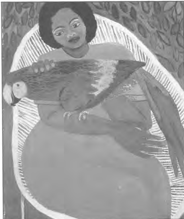
"Muchacha con lapa", June Beer