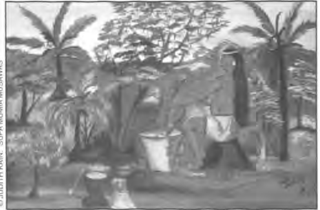
© JUDITH KAIN. "SUPA MUMIA MUSAWAS"