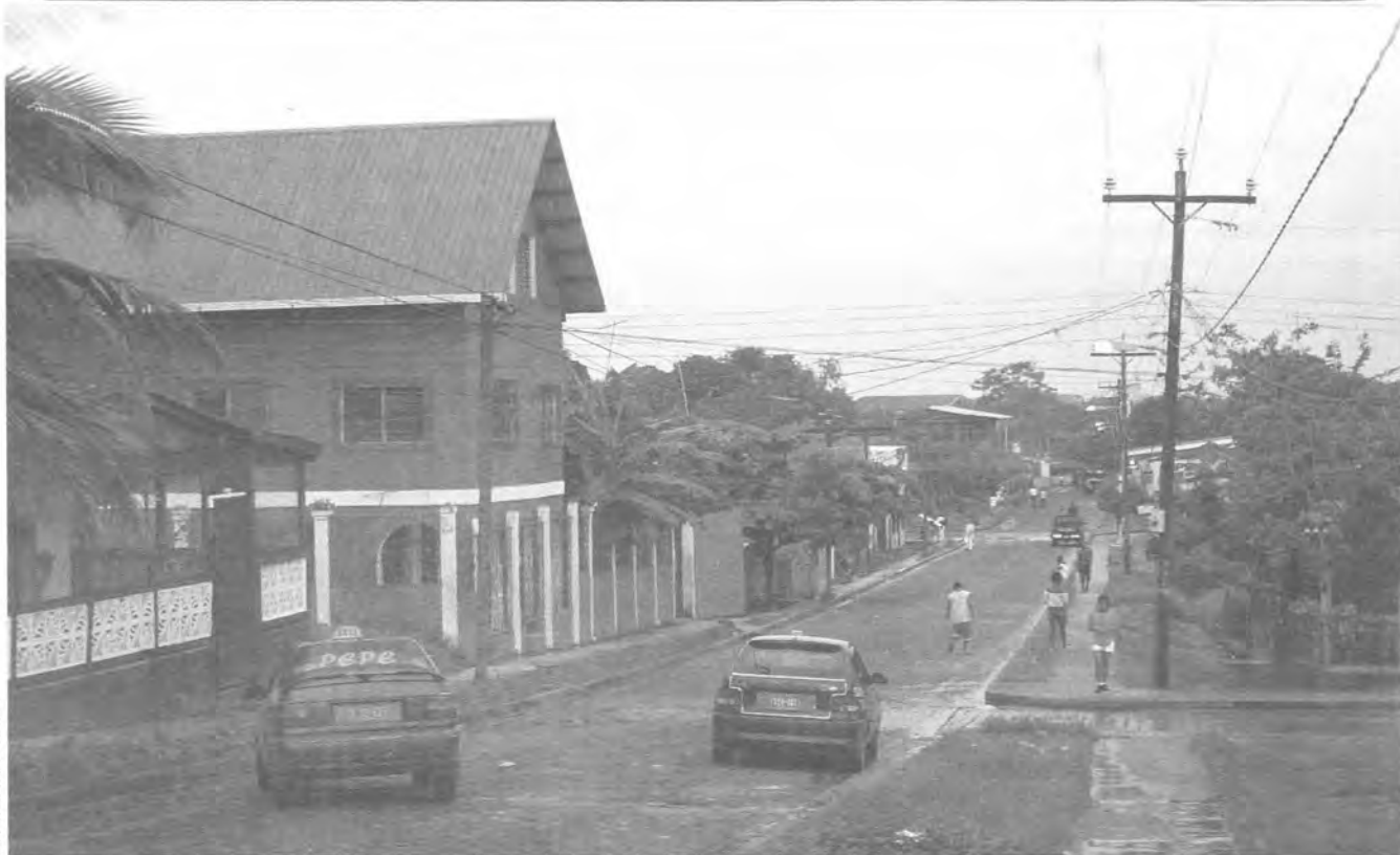
Calle de Bluefields, 2004.