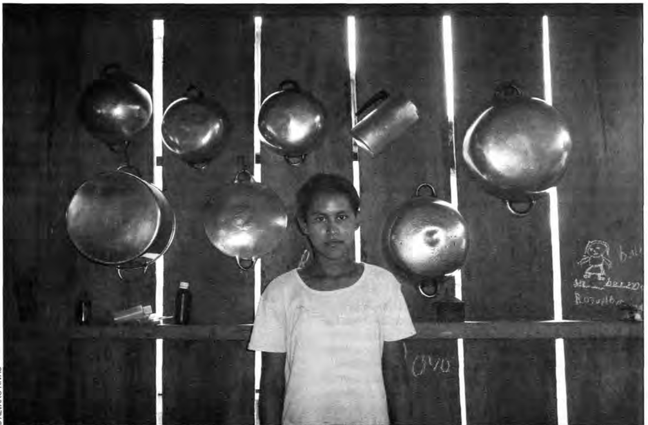
Jóven indígena luciendo sus utensilios de cocina.