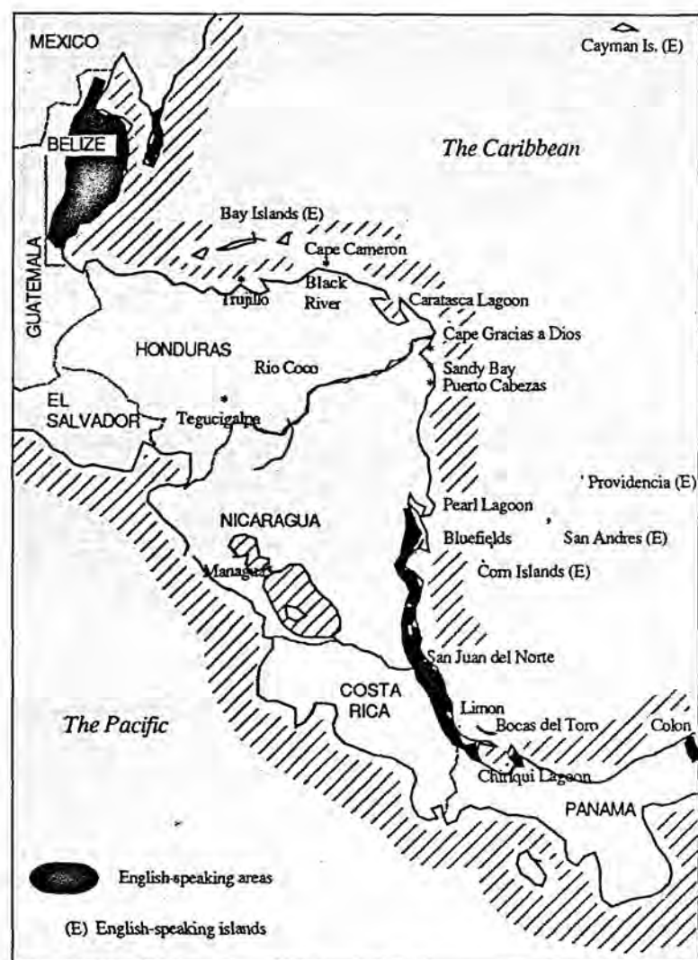
MAPA 2. Area en que se habla creole en Centroamérica

practican la horticultura y siembran, casi exclusivamente para consumo propio, plátanos, bananos, yucas y otros tipos de tubérculos. Los pescadores, muchos de los cuales también son agricultores, capturan peces con escamas (curvina, robalo y coppermouth), camarones y tortugas, que venden por dinero en efectivo 4 . La agricultura es entonces visualizada en términos de subsistencia, mientras que la pesca es concebida principalmente como una actividad generadora de dinero.