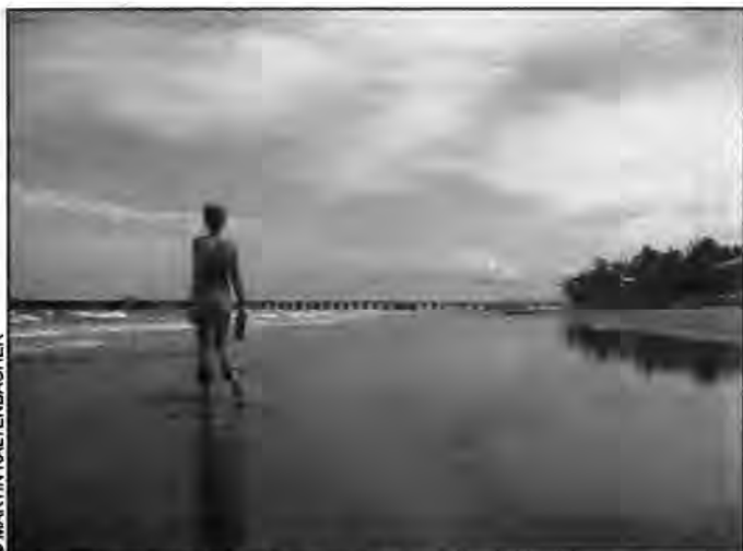
Observando el muelle de Puerto Cabezas.

(S. F.) Del apoyo que esperamos que se concrete en los próximos meses este año, en particular con el apoyo