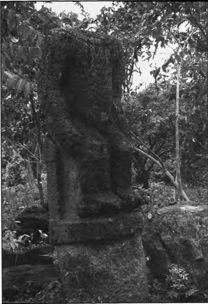
Estatua de piedra.

educación secular orientada a modelos europeos (González, 1976). Entre las nuevas instituciones establecidas figuraron también los museos nacionales de Costa Rica (1887), de El Salvador (1883) y de Nicaragua (1897). Para cumplir su tarea educativa necesitaban, sobre todo, colecciones arqueológicas (Kandler, 1987; Chaves, 1994). La exportación de objetos arqueológicos permitida por decretos presidenciales y ministeriales, se explica con la coincidencia de los intereses de los actores políticos y la concordancia de las aspiraciones emancipatorias de Centroamérica con el ideal humanista de Europa. Algunas veces las decisiones de los órganos ejecutivos se encontraban en contradicción directa con las legislaciones nacionales, por lo cual se prohibió el exportar cualquier objeto del Patrimonio Nacional (Costa Rica y Nicaragua).