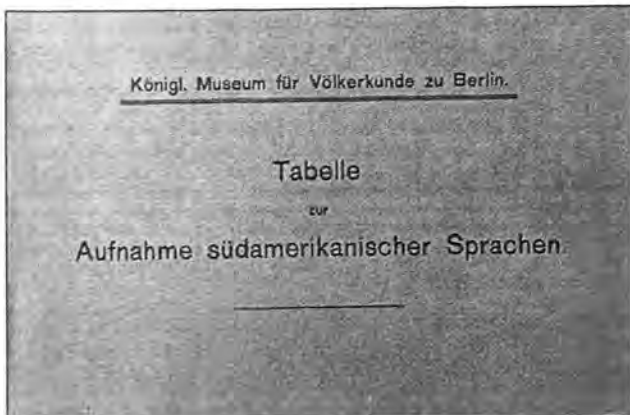
Recopilación de vocabulario.

(Ethnologisches Museum Berlin). Felix Wiss (Haberland, 1995) envió sus compendios a la Asociación de Historia Natural de Nuremburgo (Naturhistorische Gesellschaft Nürnberg) y al Museo Estatal de Antropología de Munich (Staatliches Museum für Völkerkunde München). La colección de Minor Cooper Keith fue repartida entre el American Museum of Natural History, el Museum of the American Indian (Heye Foundation), el National Museum Washington y el Brooklyn Museum de 1914 a 1929 (Mason, 1945; Saville, 1929; Steward, 1964). Los compendios de Thiel, Matarrita, Velasco y Troyo actualmente forman parte de las colecciones arqueológicas del Museo Nacional de Costa Rica. Además de inventarios arqueológicos existen también documentaciones geológicas (von Seebach), botánicas (Pittier, Polakowsky), etnográficas (Elmenhorst, Gabb, Lehmann, Rolle), lingüísticas (Conzemius, Gatschet, Lehmann, Schultze-Jena, Stoll), bibliográficas (Valentini, Behrendt) y fotográficas (de Périgny).