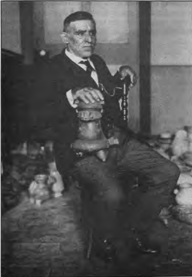
José María Velasco.