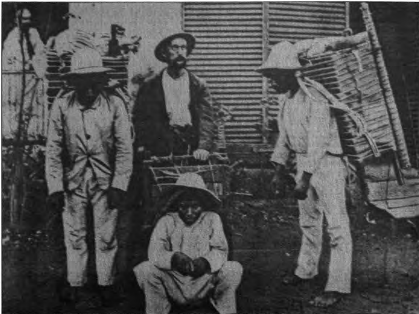
El geógrafo Sapper al centro.

A pesar del establecimiento de colecciones numerosas, pareciera que los últimos testimonios de la prehistoria humana estuviesen amenazados por la “reproducibilidad mecánica” (Benjamin, 1977: 136-69) de objetos “de arte” y por la penetración de la vida moderna en todos los sectores culturales. Se pensaba, que la reducción y sustitución de los objetos “originales” eliminaban también las tradiciones intelectuales asociadas a ellas, las cuales fueron entendidas como expresión “natural” de las normas elementales de toda la humanidad (Spengler, 1981). De esta manera parecía, que también la historia cultural de Europa estaba amenazada por los cambios profundos de una modernidad, iniciada en el mismo viejo continente (Bastian, 1885: 38-42; 1887: 8). Por el contrario, el establecimiento de colecciones arqueológicas sistemáticas servía para la conservación de una memoria universal, que se pensaba codificada en una “biblioteca” de objetos. A través de su análisis se querían guardar los orígenes de la historia humana para el futuro (Bastian, 1899: