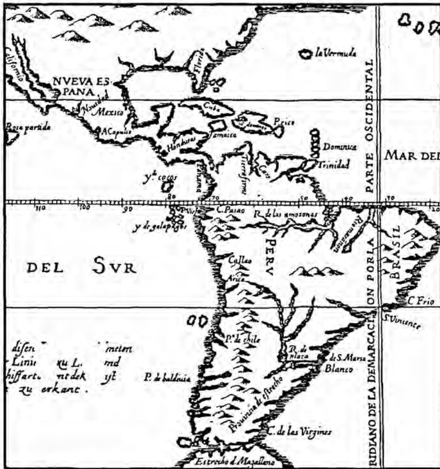
Descripción de las Indias Occidentales

Desde la Prehistoria, por lo menos hace treinta y cinco mil años, el territorio fue utilizado, si no para perseguir y trasegar semovientes, por lo menos para que el mamut, mastodontes, equus y otras especies del paleolítico transitaran por Nicaragua. Esto se ha demostrado por investigaciones paleontológicas (Espinoza; 1982) llevadas a cabo en los años setentas en El Bosque (Pueblo Nuevo, Estelí). En la Costa Atlántica, a principios de los años '70, se descubrieron cinco «shell mounds» o conchales en las cercanías de Punta Mico, posteriormente se descubrieron más de diez conchales, al norte y al sur de Monkey Point (Matilló 1993:17), con restos de tres horizontes culturales, el más antiguo de hace nueve mil años cuyos autores probablemente recorrían las costas caribeñas de América Central.