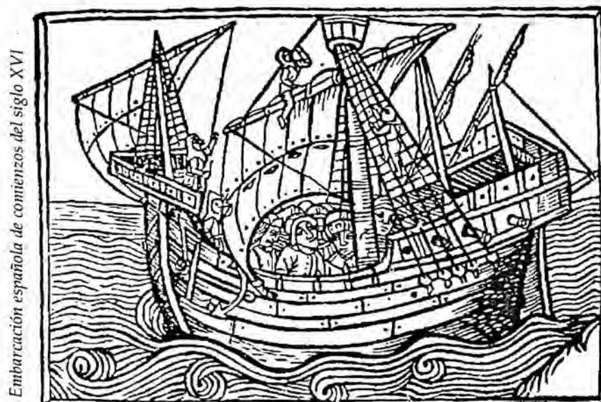
Embarcación española de comienzos del siglo XVI

Según algunos investigadores, el proyectado y apenas iniciado canal por Nicaragua a finales del siglo pasado, no fue sino una estratagema financiera que permitió que el proyecto del canal de Panamá -cuyas acciones estaban en poder de capitalistas franceses- cambiara de dueño pasando al capital newyorquino. De esta forma, el proyectado canal por Nicaragua, con su ciudad América, quedó