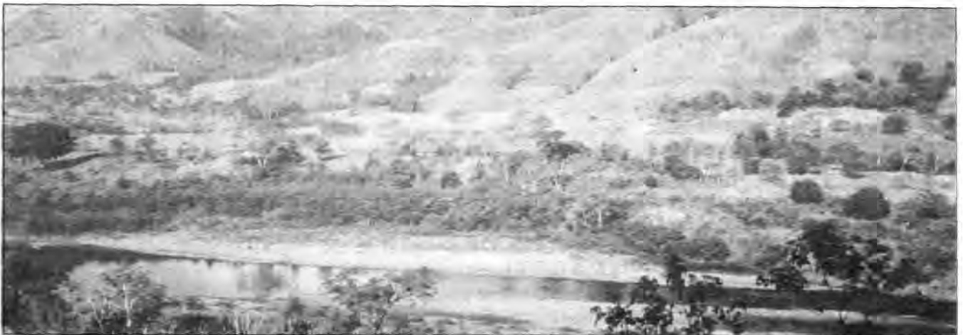
Río Coco arriba, zona de amortiguamiento de la Reserva.

También desde el norte, específicamente de tierras mexicanas, vinieron corrientes migratorias sucesivas entre los siglos IX y XIV de la era presente (Hurtado de Mendoza 1999). El drástico reemplazo de rasgos culturales está siendo adecuadamente registrado por las investigaciones arqueológicas. También se corrobora este proceso por el predominio enfático de las lenguas nahuatl en toda la región del Pacífico de Nicaragua al llegar los españoles en el siglo XVI. Los datos etnohistóricos ofrecen un panorama bastante claro de esta hegemonía mesoamericana representada por tres grupos étnicos: los chorotegas, los maribios y los nahuatlans. De acuerdo con los datos disponibles, cada uno de estos grupos étnicos estaba conformado por diversas tribus, existiendo registro de unas diez tribus en total, pero la estructura étnica de éstas podría haber sido aún más compleja, pues los pueblos de origen mesoamericano hablaban no menos de seis idiomas claramente discernibles en términos lingüísticos: el chorotega, el subtiaba, el nicarao, el tacacho, el huave y el poton o putum. Esta mayor complejidad podría corres-