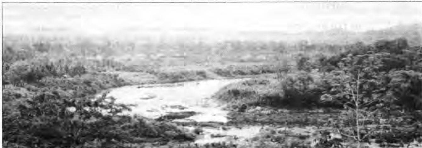
Río Coco arriba, zona de amortiguamiento de la Reserva.