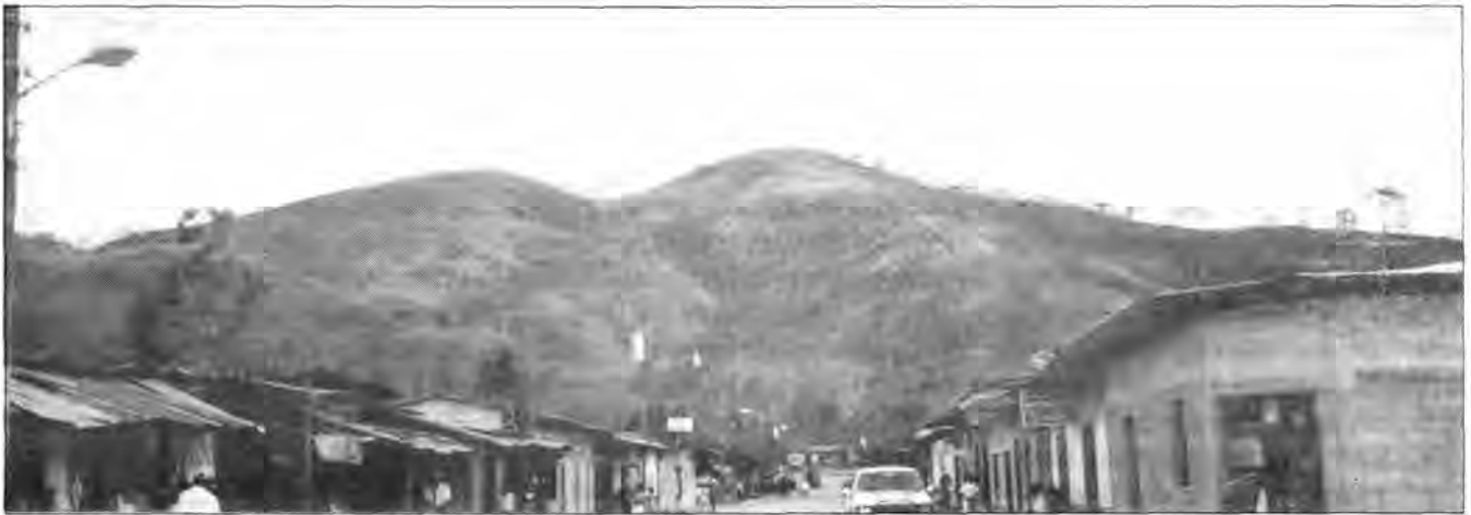
Wivili, frente de colonización, zona de amortiguamiento de la Reserva.

están muy adentro de los territorios indígenas mencionados, a pesar de que han sido delimitados por sus pobladores indígenas.