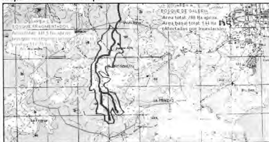
Mapa 1. Areas de bosque

La temperatura promedio anual de la zona es de 26°C y una humedad relativa promedio de 85%. El promedio de precipitación anual en la zona es de 4.208mm. Los suelos del sitio donde se realizó el