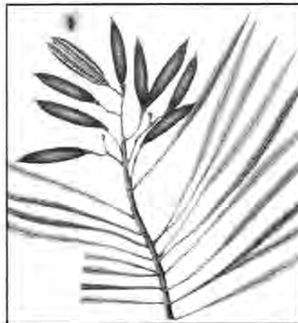
Chilca de río, Astianthes viminalis

En América se encuentra desde Guatemala hasta Panamá en los Bosques Húmedos y Muy Húmedos de tierras y colinas bajas hasta 500-600 msnm; en Nicaragua se distribuye en los bosques húmedos de la Costa Atlántica; crece mezclada con especies como cedro macho ( Carapa guianensis ), gavilán ( Pentaclethra macroloba ), almendro ( Dipteryx panamensis ) y Comenegro ( Dialium guianensis ); en condiciones naturales es de crecimiento moderado, entre 0.48-0.78 m al año, sin embargo, en plantaciones se ha reportado un incremento medio anual de entre 1.92-2.26 m al año.