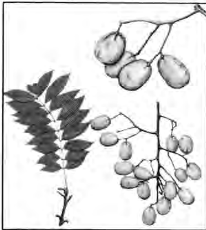
Jobo, Spondias mombin

Sin embargo, debido al mismo abandono de las fincas es notable una recuperación del bosque tanto en la ribera del río Escocfram como en áreas entremezcladas con los potreros, donde se notan parches considerables de árboles de especies pioneras y de bosques secundarios.