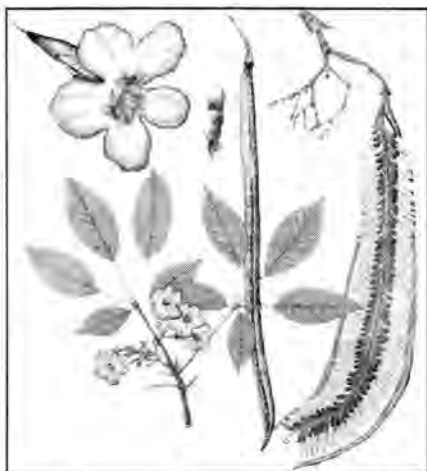
Roble sabanero, Tabebuia rosea

En todos los trayectos se observaron potreros abandonados de pasto Retana y algunas especies arbóreas y arbustivas no maderables, creciendo de forma esparcida; así como áreas pequeñas de bosques secundarios y/o en regeneración. Tres de estos bosques ubicados en el área B se muestrearon (ver inventarios forestales para los transectos 3, 5 y 8) y dos en el área C (inventarios de los transectos 1 y 7).