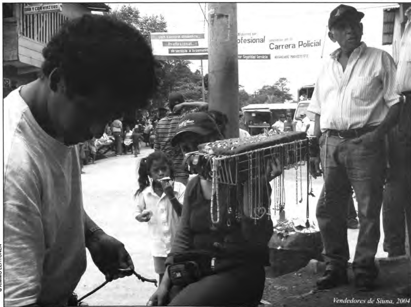
Vendedores de Siuna, 2004

El panamahka, tawahka y tuahka son claramente variantes de una misma lengua (el mayangna o sumu septentrional, o sumu del norte), mientras que el ulwa es claramente una lengua diferente (según ya mostró Hale 1991b). Aun así, tanto ulwa como mayangna pueden considerarse parte de la rama sumu: ulwa como sumu meridional o del sur, y mayangna, como sumu septentrional o del norte. Tanto las gentes que hablan ulwa como las que hablan mayangna pertenecen al mismo grupo étnico, el sumu; sin embargo, sus lenguas son lenguas diferenciadas e independientes, aunque mantienen una relación estrecha (mucho más estrecha que con el miskitu, por ejemplo).