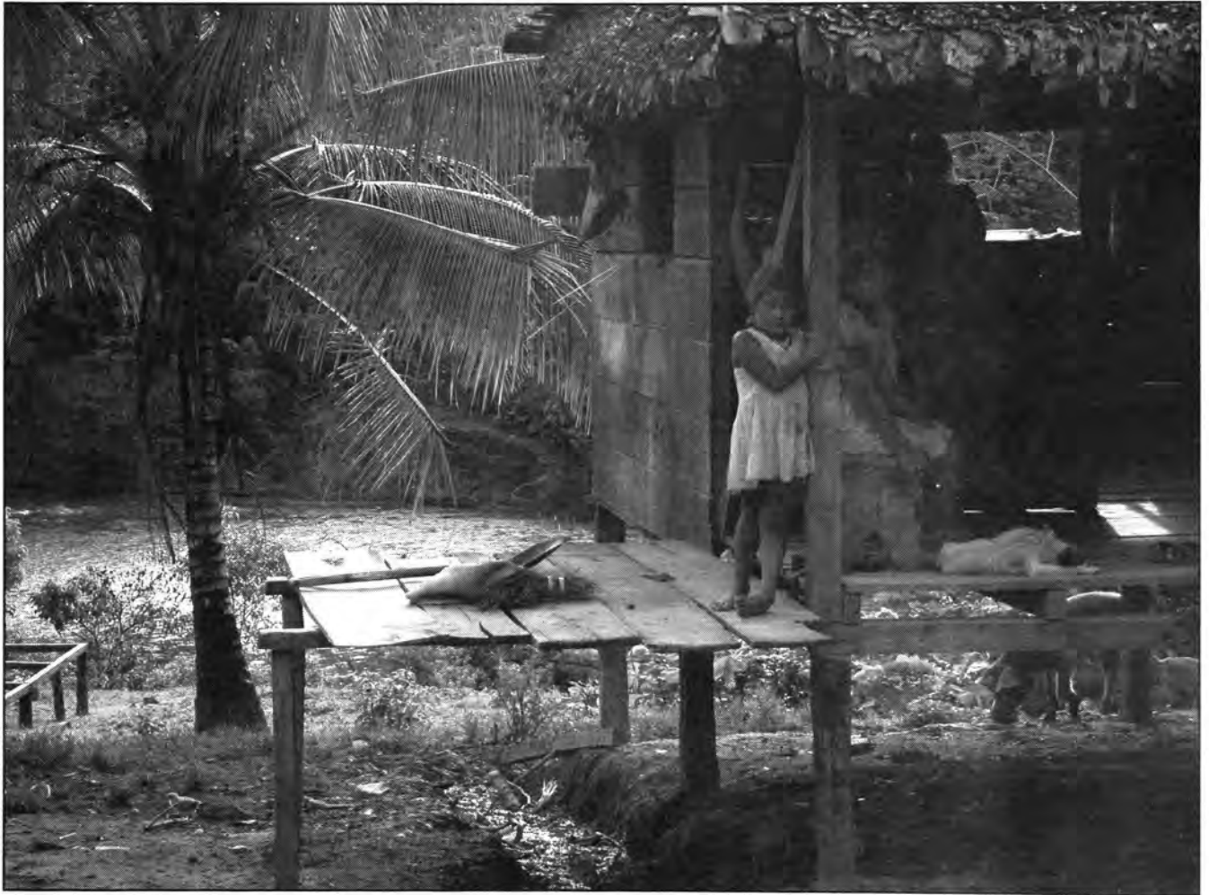
Mayangnas de Sikilta, 2004