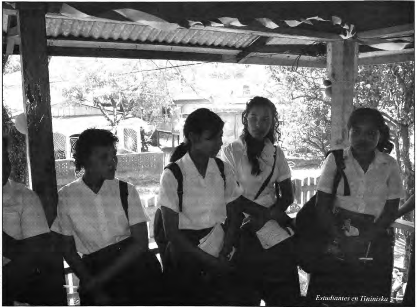
Estudiantes en Tininiska

Es necesario encontrar –ahora que es todavía posible– nuevas formas de resistir a la reducción del uso de las lenguas indígenas. Ganar terreno en vez de siempre ceder. Para los idiomas como el miskito, que están todavía vigorosos, hay que aprovechar las oportunidades que existen o que se están creando para extender el dominio de su utilización a la lengua escrita. En la sección siguiente vamos a explorar las consecuencias de una medida que podría favorecer la supervivencia y desarrollo del miskito: la promoción de una literatura miskita en miskito.