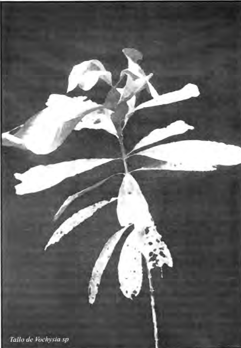
Tallo de Vochysia sp