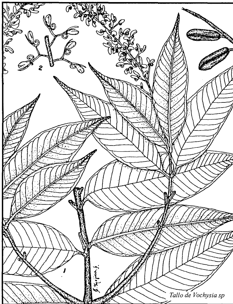
Tallo de Vochysia sp

Hicimos el primer inventario pos-raleo entre el 12 y el 16 de febrero, 2002. Medimos los DAP de todos los árboles, incluso los nuevamente reclutados, y notamos sus rebrotes basales grandes y pequeños de la misma manera que el año anterior. También notamos la presencia o ausencia de rebrotes en los árboles talados.