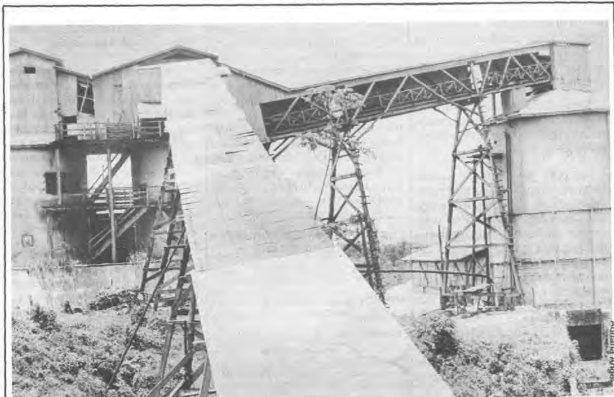
Mina Rosita en abandono