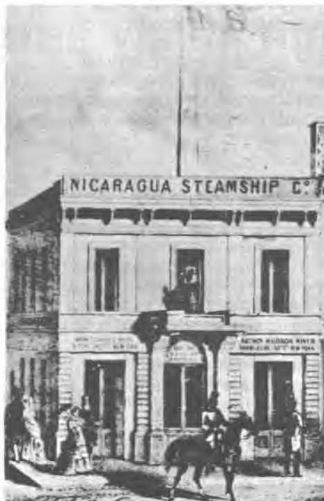
OFFICE OF NICARAGUA STEAMSHIP COMPANY IN SAN FRANCISCO, 1854

Este triunfo parcial de nuestro pequeño país se debió a la correlación de fuerzas que surgió entre