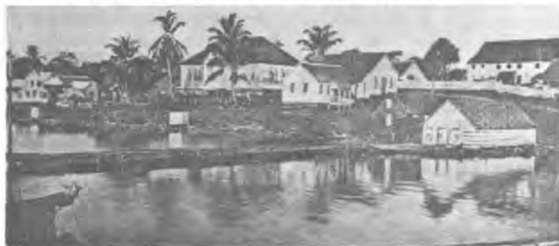
Edificios de la Misión Morava en Bluefields.